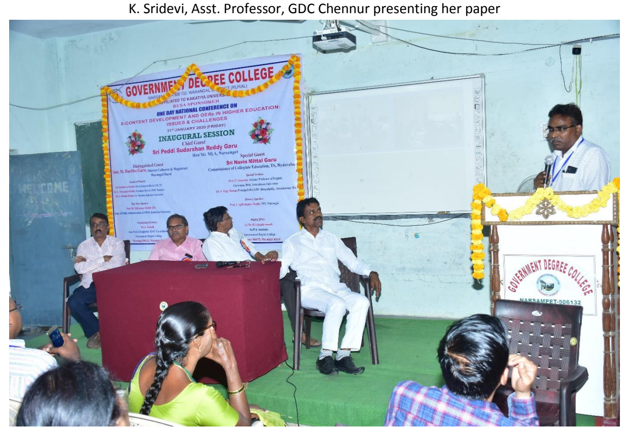
GOVERNMENT DEGREE COLLEGE NARSAMPET 506 132, WARANGAL RURAL, TELANGANA STATE