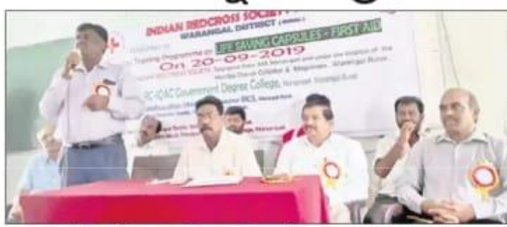
సదస్సులో మాట్లాడుతున్న జిల్లా వైద్య అరోగ్యశాభాధికాల మధుసూదన్