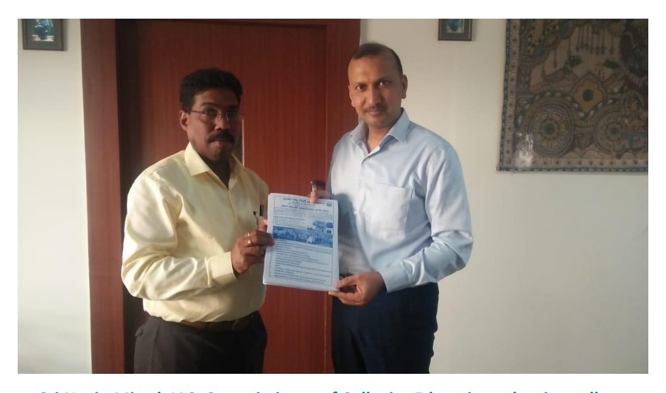
Sri Navin Mittal, IAS, Commissioner of Collegite Education releasing college Brochure in connection with Admission campaign