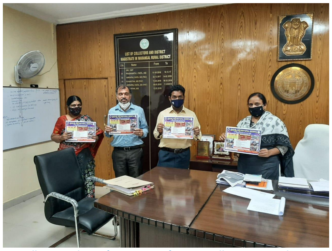
College Brochures for 2020-21 of GDC Wardhannapet are being released by the District Collector.