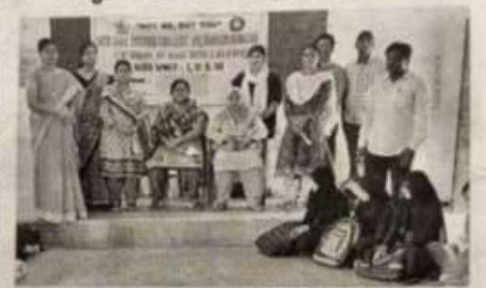
ಮೀಲ್ಲರುಕುನ್ನ ಸಿಬ್ಬರ್ಕ್ ಕೆಚೆ ಕ್ಷಿಬರೆ

పాలమూరు యూనివర్నిటీ : మహబూట్నగర్ పట్టణంలోని ఎన్టీఆర్ మహీళా డిగ్గీ కళాశాలలో స్మిల్ డెవలపేమెంట్ఫ్ అవగాహన కార్య జైమం ఈ నెల 27 నుంచి సెప్టెంబర్ 4వరకు నిర్వహించడం జరుగు తుందని ఎన్టీఆర్ డిగ్లీ కళాల టైప్పిపాల్ చీట్ తైనట్ పేర్కొన్నారు. సోమవారం ఈ కార్యకమావ్స్ అయన ప్రారంభించి మాట్లాడారు. విద్యార్థులు సమాజంలో మార్పు కోసం యువత పాత్ర అనే అంకంపై మొదటిరోజు నాలుగు బ్యాపిలుగా విద్యార్థులను విడదీపే 200 మంది విద్యార్భంతే కార్యక్రమం విర్వహించినట్లు పేర్కొన్నారు. కార్యక్రమా నికి హాజరయ్య విద్యార్తులకు మధ్యాహ్న లోజన వసతి కూడా కత్సిం దడం జరుగుతుందని పేర్పొన్నారు. ఎనేజీవో స్ట్రీం ద్వారా శిక్షణా కార్య క్రమం నిర్వహించడం జరుగుతుందని, ఇందులో వాలెస్ట్. హెల్ట్, ఎర్వు కేషన్, కమ్యూనికేషన్ స్కిల్స్, హోటు ఎంపవర్ యంగ్ ఉమెన్ ఇన్ ది. పాస్టెటీ (ఎస్టీవోస్) సంస్థ ద్వారా ప్లోగ్రాం విర్వహించరం జరుగుతుం డ్నూరు. రోజువారీగా వారం రోజులపాటు ఉదయం 10 గంటల మంది 11 గంటల వరకు విద్యార్థులు స్విల్ డెవలస్ముంట్ఫ్ అవగా హన కార్యక్రమం ఉంటుందన్నారు. ఈ స్వచ్ఛంద సంస్థను మహబా టిహార్ జిల్లా కలెక్టర్ రావాల్టరోప్ ఆడేశాల మేరకు కార్యక్రమం చేప టైడం జరిగిందని, విద్యార్థులు ఉత్సాహంగా పాల్గొని శిక్షణ పాండా ర్బెందిగా కోరారు. కార్యక్రమంలో ప్లోగాం కోజర్జినేటర్ చనిత్వుల్, టైనర్ను పైజ, నాయినిక, ప్యవి, మాశవిక, ప్రతిభలు పాల్గొన్నారు.