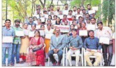
సర్టిఫికేట్లు అందుకున్న శిక్షణ పూర్తిచేసుకున్న విద్యార్థులు

పంజగుట్ట: చింతల్ బస్టీలోని ఖైరతాబాద్ ప్రభుత్వ డిగ్రీ కాలేజీలో విద్యార్థులు, రాష్ట్ర ప్రభుత్వం సంయుక్త ఆధ్వర్యంలో మహేంద్ర ఫ్రైడ్ క్లాస్ రూమ్, నాంది ఫౌండేషన్ సాజన్యంతో నిర్వహించిన ఉద్యోగ నైపుణ్య శిక్షణ శిబిరం బుధవారం ముగిసింది. ఈ నెల 6 నుంచి కొనసాగుతున్న ఈ శిబిరంలో బీఏ, బీకాం తృతీయ సంవత్సర విద్యార్థులు 43 మంది శిక్షణ పొందారు. శిక్షణ పూర్తిచేసుకున్న విద్యార్థులకు సర్టిఫికేట్లు బుధవారం అందించారు. విద్యార్థులు సాఫ్ట్ స్కీల్స్, కమ్యూనికేషన్ స్కీల్స్, లైఫ్ స్కీల్స్, ఇంటర్వ్యూ స్కీల్స్ నందు శిక్షణ పొందారు. ఈ శిక్షణ కార్యక్రమాలు విద్యార్థులకు ఎంతో ఉపయోగపడతాయని, వచ్చిన అవకాశాలు సద్వినియోగం చేసుకుని ముందుకు సాగాలని విజువల్ సంస్థ