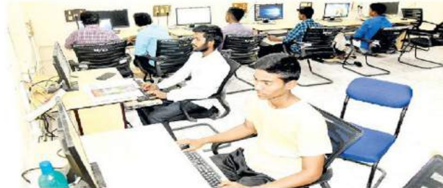
ఆదిలాబాద్ ప్రభుత్వ డిగ్రీ కళాశాలలో నికంప్యూటర్ ల్యాబ్ ల్యాబ్, ఇంగ్లీష్ ల్యాబ్, టీఎన్కెసీ, క్యాంపస్ ఉన్నాయి. ఇవే కాకుండా కళాశాల విద్యార్థుల కోసం సువిశాలమైన ఆటస్థలం అందుబాటులో ఉంది. దీనికి తోడు యువతకు రెండు ఎన్సీసీ యూనిట్లు, ఎన్ఎస్ఎస్లలో శిక్షణ ఇవ్వడానికి ప్రత్యేక యూనిట్లు అందుబాటులో ఉన్నాయి. రాష్ట్రంలో ఎక్కడి నుంచైనా విద్యార్థులు పాఠ్యాంశాలను వినడానికి అవసరమైన వర్చువల్ ఇంటర్నెట్ కూడా కళాశాలలో అందుబాటులో ఉంది.