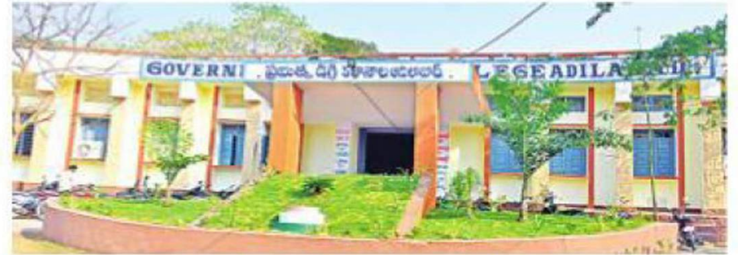
జిల్లా కేంద్రంలోని ప్రభుత్వ డిగ్రీ కళాశాల

ఆదిలాబాద్ అర్బన్, మార్చి 14: జిల్లా కేంద్రంలోని ప్రభుత్వ డిగ్రీ కళాశాలకు ఘనమైన చరిత్ర ఉంది. ఈ కళాశాల చరిత్ర రిసిపెక్టుకు చేరుకుంది. ఈ కళాశాల అనేక మంది ప్రముఖులు, రాజకీయ వేత్తలు, అధ్యాపకులు, ఉద్యోగులను సమాజానికి అందజేసింది. ఘనమైన చరిత్ర దక్కించుకున్న ఆదిలాబాద్ ప్రభుత్వ డిగ్రీ కళాశాలను ముచ్చటగా మూడవ సారి న్యాక్ బృందం సందర్శించనుంది. ఈ న్యాక్ బృందం గుర్తింపుకు సైతం కళాశాల మరోసారి సిద్ధమైంది. ఆదిలాబాద్ పట్టణంలోని శాంతినగర్ కాలనీలో ఉన్న ఈ ప్రభుత్వ డిగ్రీ కళాశాల 1957 ఏప్రిల్ 1వ తేదీన స్థాపించబడింది. ప్రస్తుతం ఈ కళాశాలలో 870మంది విద్యార్థులు, 23 మంది అధ్యాపకులు ఉన్నారు. గతేడాది వరకు కేవలం ఆర్ట్స్, కామర్స్, సైన్స్ కోర్సులు మాత్రమే ఉండగా ప్రస్తుతం పీజీ కళాశాలకు రూపాంతరం చెందింది. జాతీయ స్థాయి గుర్తింపు జాబితాలో చోటు దక్కించుకోవడానికి కేంద్రం నుంచి నిధులు రాబట్టుకోవడానికి ఈ న్యాక్ గుర్తింపు తప్పని సరి. ఈ కళాశాల ఇప్పటికే రెండు సార్లు న్యాక్ బృందం ద్వారా బీ గ్రేడ్ ను సాధించింది. బీ గ్రేడ్ తర్వాత మరో సారి ఏ గ్రేడ్ ను సాధించేందుకు ప్రయత్నాలు జరుగుతున్నాయి. గతంలో బీ గ్రేడ్ సాధించిన ఈ కళాశాలకు రూ.5 కోట్ల నిధులు అందుకొని ఈ కళాశాలలో కంప్యూటర్ ల్యాబ్, అదనపు బిల్డింగ్, స్కీల్ డెవలప్ మెంట్ లాబ్, 35వేల పుస్తకాలతో అతిపెద్ద గ్రంథాలయం ఏర్పాటు చేశారు. ఈ సారి ఏ గ్రేడ్ గుర్తింపు లభిస్తే దాదాపు ఈ కళాశాలకు రూ.5 కోట్ల నిధులు వచ్చే అవకాశం ఉంది. ఈ నిధులతో కెమిస్ట్రీ బోటనీ, పీజీ కోర్సుల ఏర్పాటుతో పాటు మరికొన్ని కోర్సులు ఏర్పాటు చేసే యోచనలో పాలక వర్గం సిద్ధమవుతుంది. ఏ గ్రేడ్ సాధించే దిశగా బృందం సూచించే సలహాలో భాగంగా ఇదివరకే ఈ కళాశాలలో పూర్వ విద్యార్థుల కమిటీని సైతం ఖరారు చేశారు.