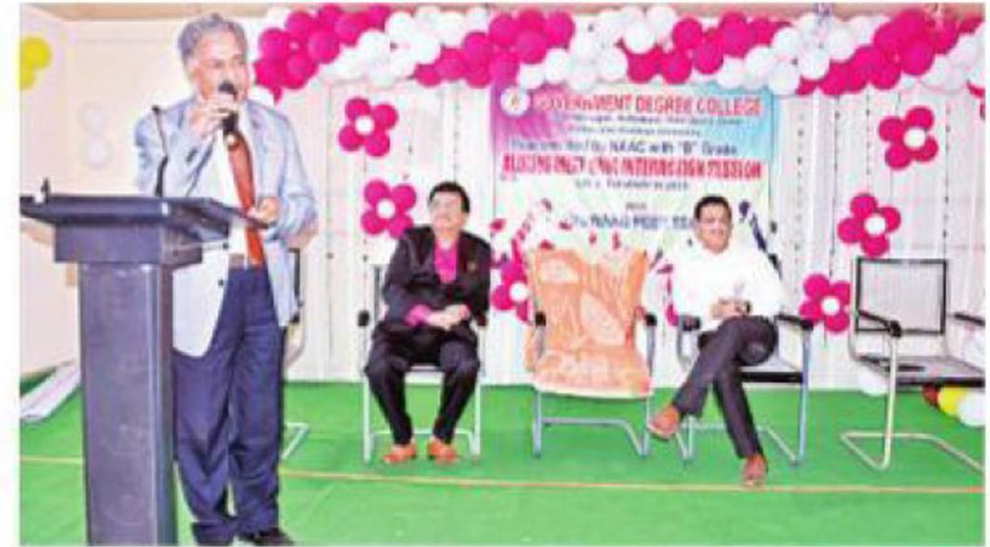
కళాశాలలో ఏర్పాటు చేసిన సమావేశంలో మాట్లాడుతున్న న్యాక్ కమిటీ చైర్మన్