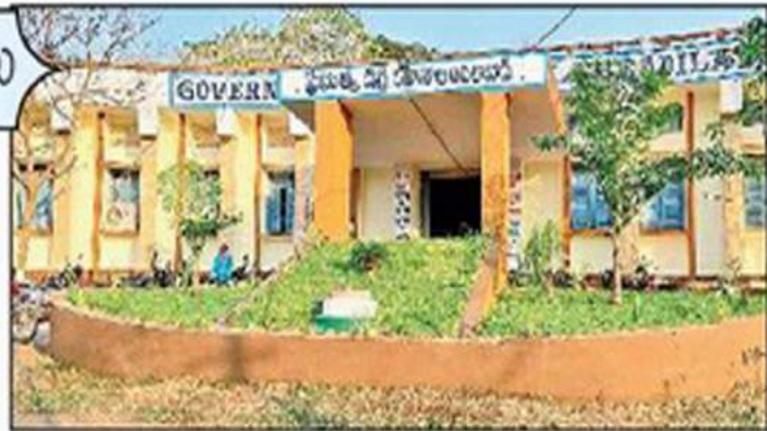
పర్యాటక చేయించిన వచ్చిక

న్యూస్టుడే, పాలనాప్రాంగణం: తమను ఇంత వారిని చేసిన కళాశాలకు తమవంతు తోడ్పాటు అందించేందుకు నడుం బిగించారు ఆదిలాబాద్ ప్రభుత్వ డిగ్రీ కళాశాల పూర్వ విద్యార్థులు. కిందటిసారి న్యూక్ బృందం ఎత్తిచూపిన లోపాలను సవరించే దిశగా చర్యలు ముమ్మరం చేశారు. ఇప్పటికే విరాళాల రూపంలో సహచరులు ఇచ్చిన సొమ్ముతో పలు సౌకర్యాలను సమకూర్చారు. సోమవారం కళాశాల సందర్శనకు న్యూక్ బృందం రానుంది.