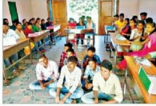
క్విజ్ లో పాల్గొన్న విద్యార్థులు