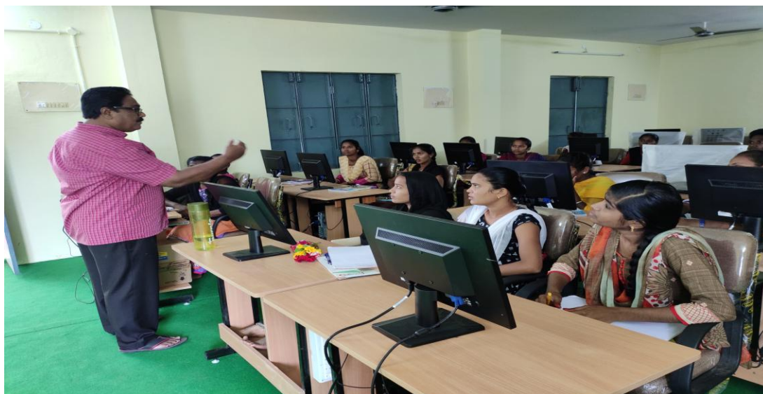
Extension Lecture in Botany