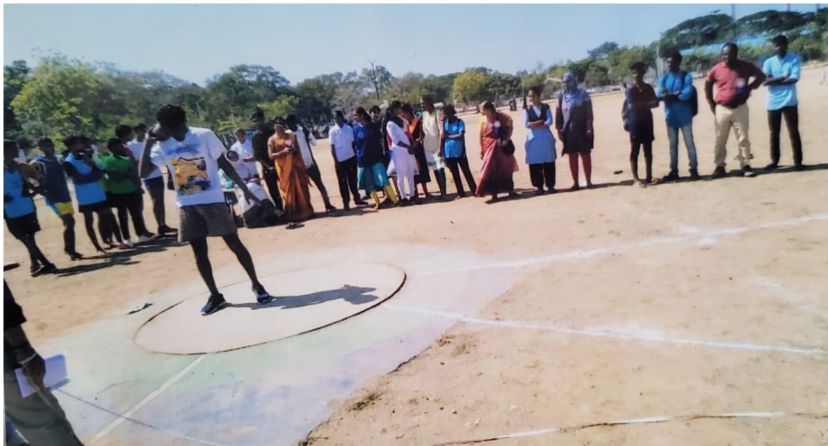
Shot-put Competition at cluster level