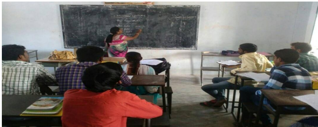
Extension Lecture in History

2. Extension Lectures: to enhance the acquired knowledge institution conducts extensive lectures by eminent resource persons.