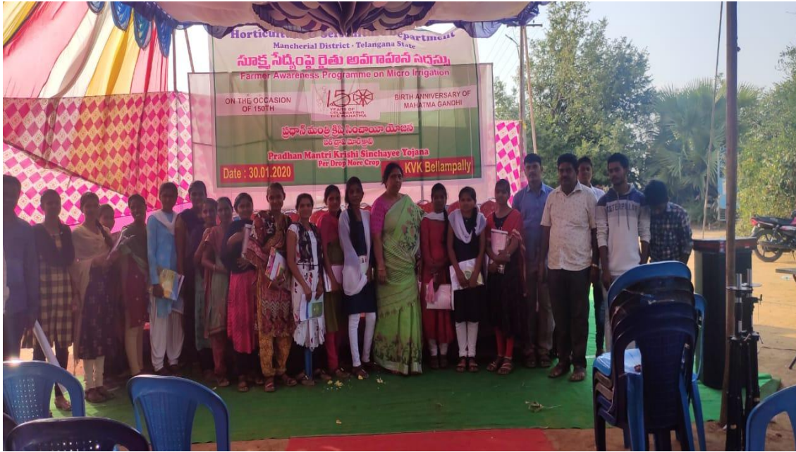
Life sciences field trip (2019-20)