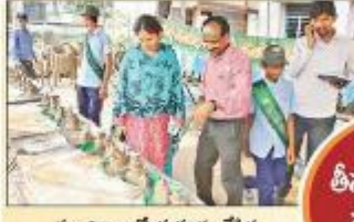
తాండూరులో తయారు చేసిన మట్టి విగ్రహాలను పంపిణీ చేస్తున్న ఆర్డీసీ

మట్టి ప్రతిమలే శ్రేయస్కరం.. మట్టి ప్రతిమలే శ్రేయస్కరం.. మట్టి ప్రతిమలే శ్రేయస్కరం.. మట్టి ప్రతిమలే శ్రేయస్కరం.. మట్టి ప్రతిమలే శ్రేయస్కరం.. మట్టి ప్రతిమలే శ్రేయస్కరం.. మట్టి ప్రతిమలే శ్రేయస్కరం..