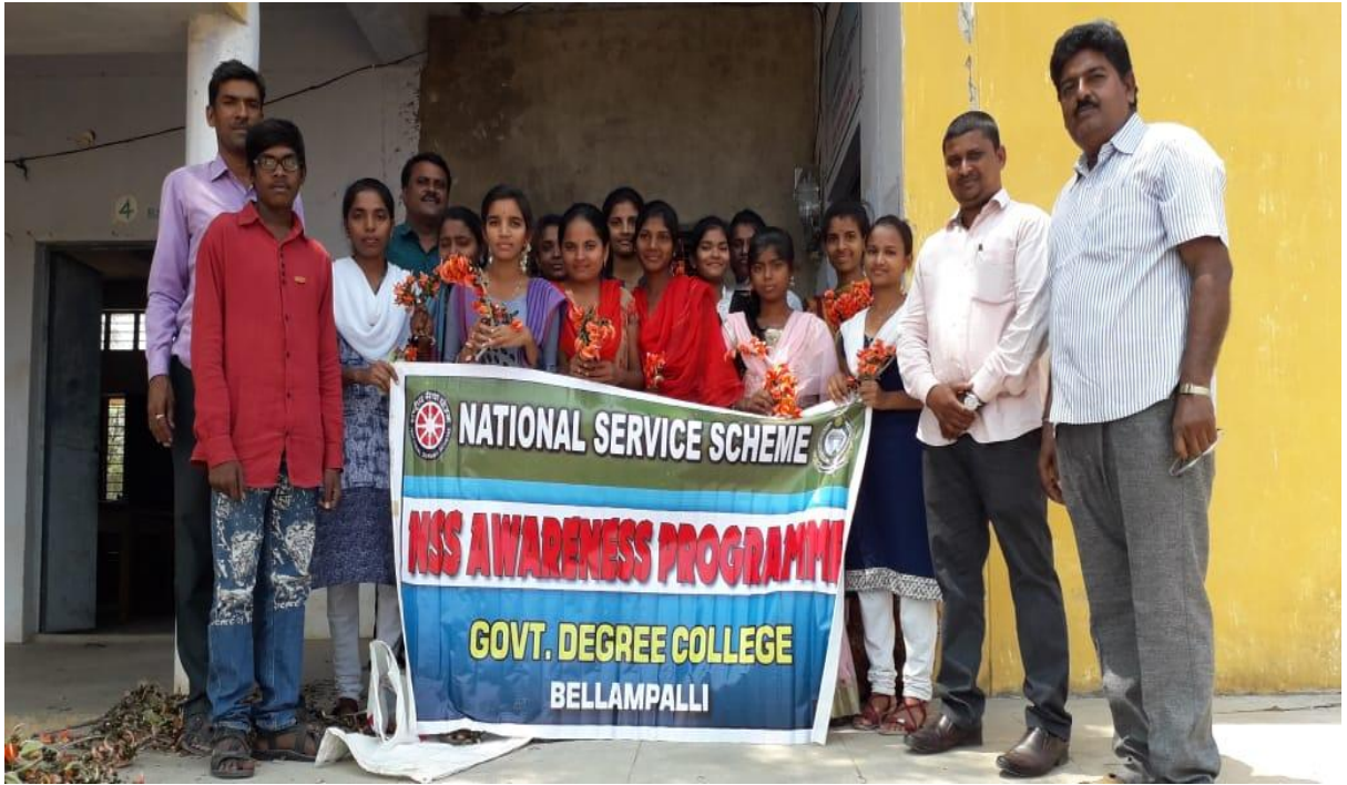
Preparation of natural colours