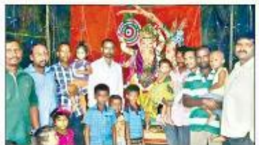
విశ్వవిద్యాలయంలో మట్టి విగ్రహాల ప్రతిష్ఠిస్తున్న తాండూరు నిర్వహించారు గతేండ్ల నుండి యజమాని

తాండూరు మండల కేంద్రంలోని విశ్వ విద్యాలయంలో గతేండ్ల నుండి యజమాని బిల్డింగ్ మట్టి ప్రతిమల తయారీని ప్రోత్సహిస్తున్నారు. విశాలమైన ప్రతిమల తయారీకి మట్టి శ్రేయస్కరం.. మట్టి శ్రేయస్కరం.. మట్టి శ్రేయస్కరం.. మట్టి శ్రేయస్కరం.. మట్టి శ్రేయస్కరం.. మట్టి శ్రేయస్కరం.. మట్టి శ్రేయస్కరం..