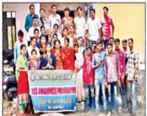
సహజ రంగులు తయారుచేసిన విద్యార్థులు