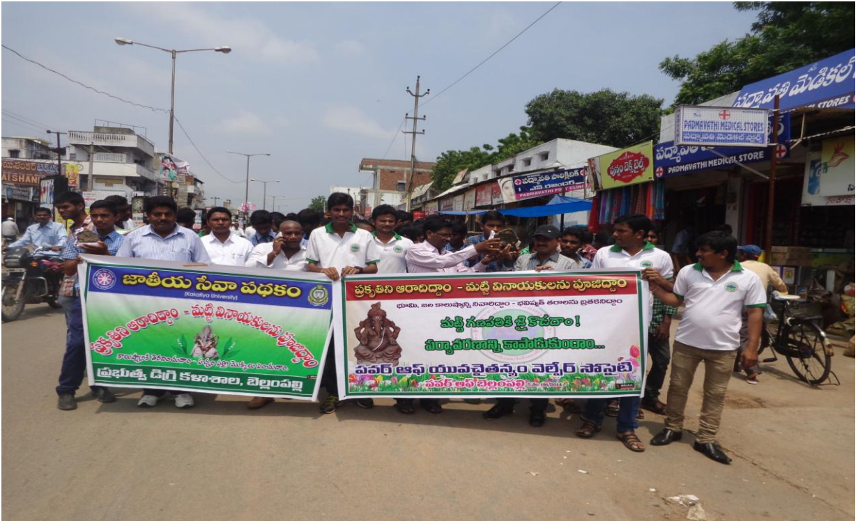
Awareness Rally organized by NSS unit and other NGOs