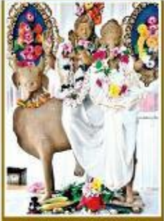
తాండూరు మండల కేంద్రంలోని విశ్వవిద్యాలయంలో గత సంవత్సరం ప్రతిపాత్రమని

మన ప్రకృతిలో మట్టి ప్రతిమలే శ్రేయస్కరం.. మట్టి ప్రతిమలే శ్రేయస్కరం.. మట్టి ప్రతిమలే శ్రేయస్కరం.. మట్టి ప్రతిమలే శ్రేయస్కరం..