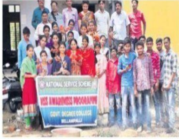
రంగులు తయారు చేస్తున్న విద్యార్థులు