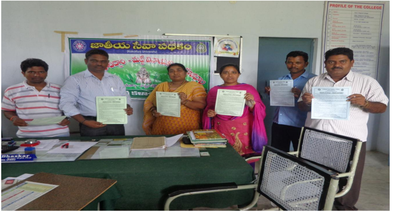
Releasing pamphlet on ecofriendly Lord Ganesh