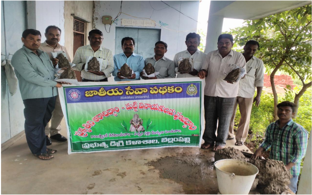
Preparation and distribution of clay idols of Lord Ganesh