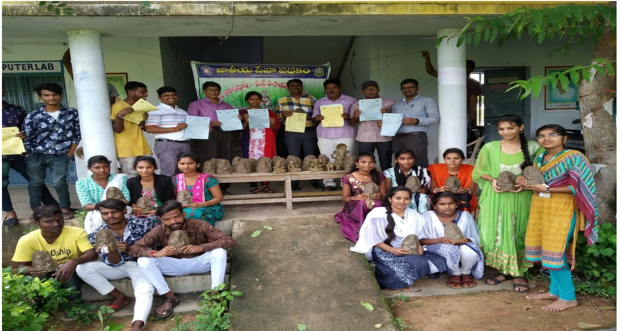
Preparation and distribution of clay idols of Lord Ganesh