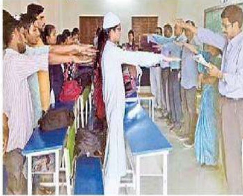
స్వచ్ఛత ప్రతిజ్ఞ చేస్తున్న అధ్యాపకులు, విద్యార్థులు