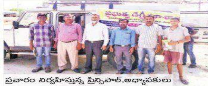
ప్రచారం నిర్వహిస్తున్న ప్రిన్సిపాల్, అధ్యాపకులు

పటాన్చెరుటౌన్ : ప్రవేటుకు దీటుగా రాణిస్తున్న ప్రభుత్వ కళాశాలలోనే మీ పిల్లలను చేర్పించాలని కోరుతూ, పటాన్చెరు ప్రభుత్వ డిగ్రీ కళాశాల అధ్యాపకులు గ్రామాలలో పర్యటించారు.