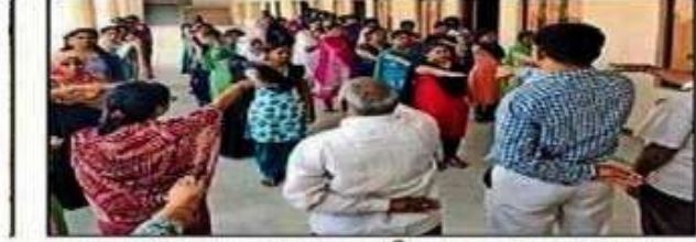
పటాన్చెరు ప్రభుత్వ డిగ్రీ కళాశాలలో ప్రతిజ్ఞ