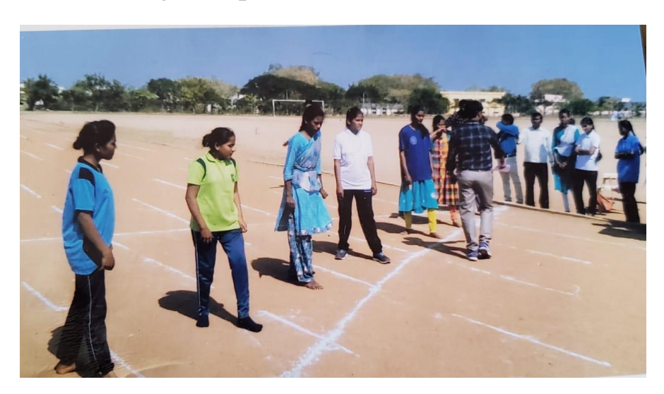
Shot-put Competition at cluster level