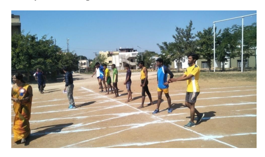
Long jump competition at college level in bellampally