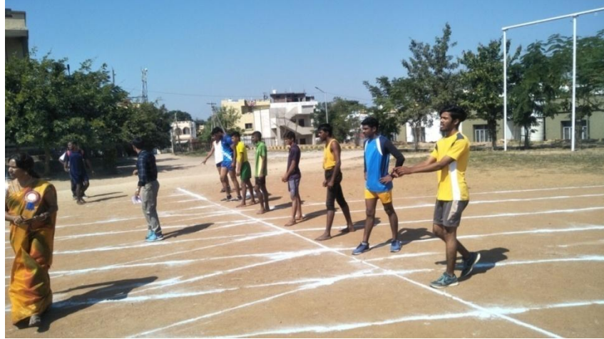
Long jump competition at college level in bellampally