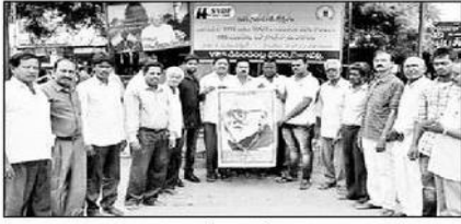
కాంటాచౌరస్తాలో కాళోజీ చిత్రపటానికి