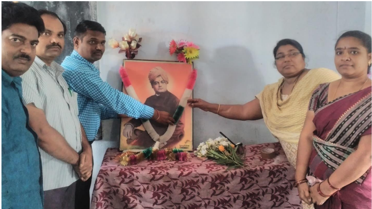
National Youth day Swami Vivekananda Birthday celebrations