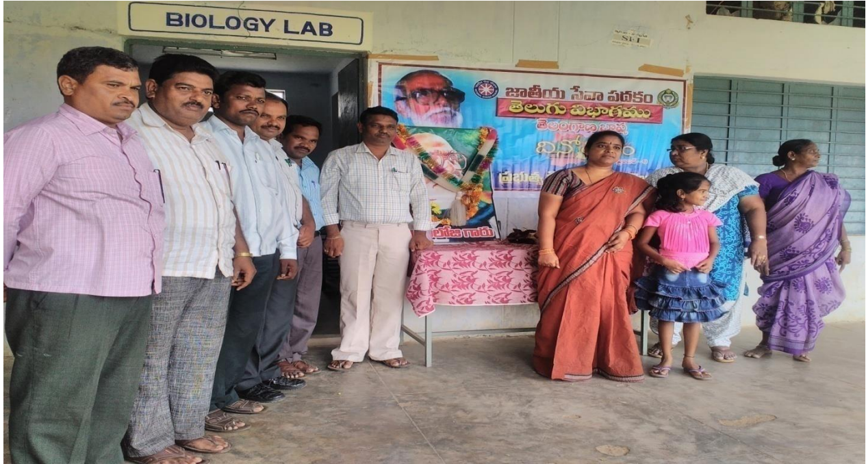
KALOJI NARAYANA RAO JAYANTHI CELEBRATION