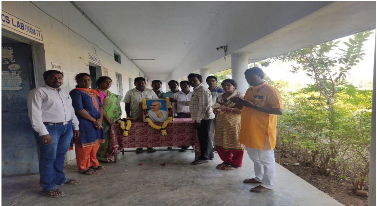
MAHATHMA GANDHIJI VARDHANTHI