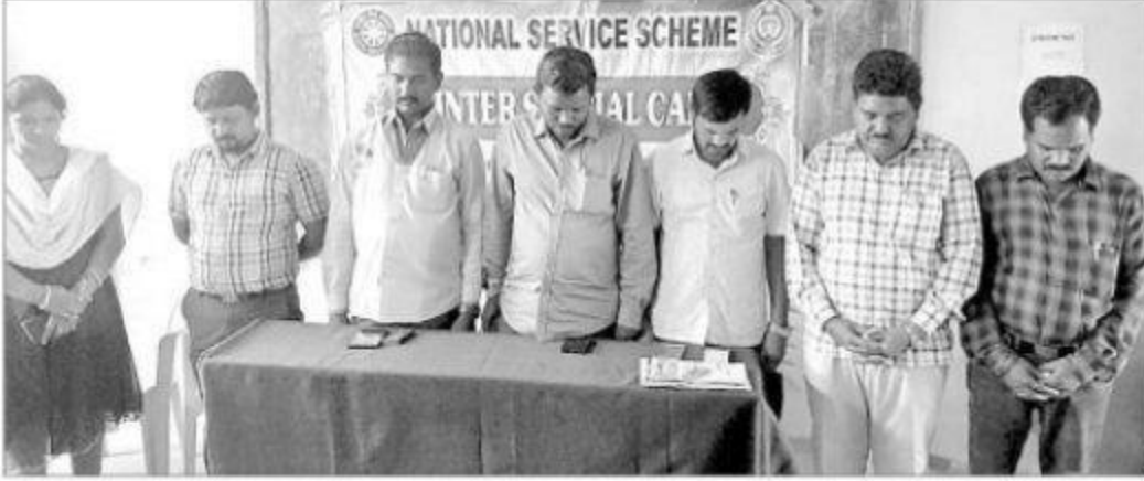
బెల్లంపల్లి రూరల్ : నివాళులర్పిస్తున్న అధ్యాపకులు