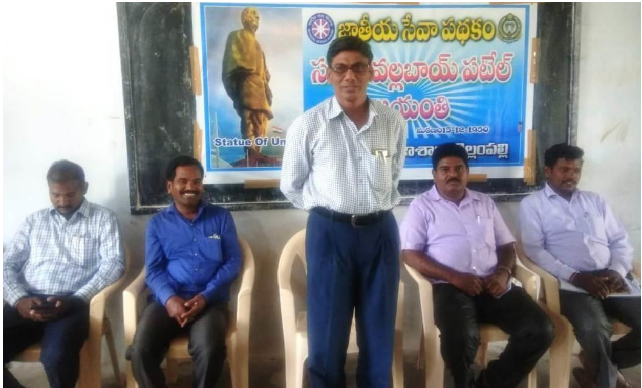
Sardar valla bai patel jayanthi