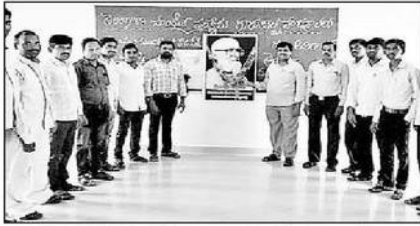
సాంఘిక సంక్షేమ బాలర పాఠశాలలో..