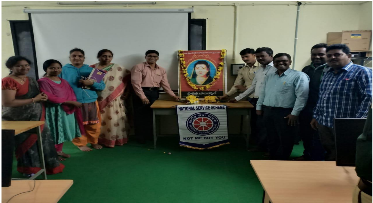
SAVITHRI BHAI PULE JAYANTHI CELEBRATED IN OUR CAMPUS