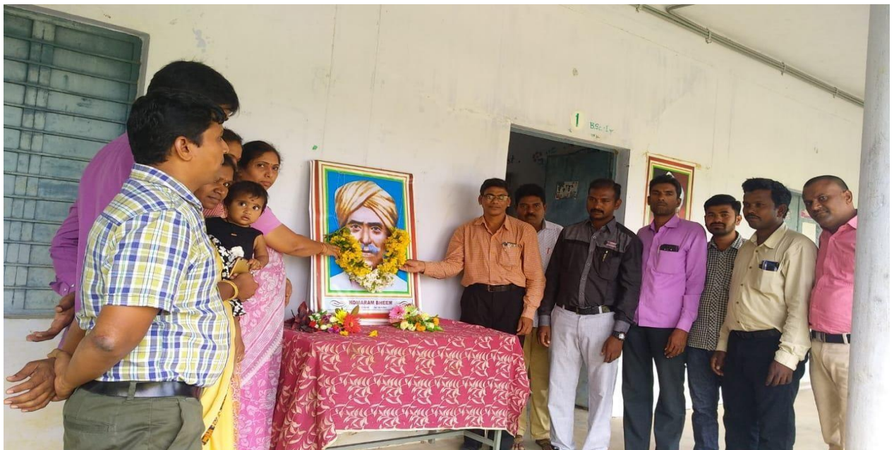
ORGANISED KOMURAM BHEEM JAYANTHI PROGRAMME