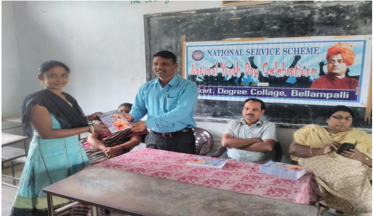
National Youth day Swami Vivekananda Birthday celebrations