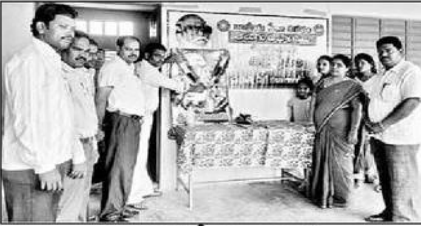
ప్రభుత్వ డిగ్రీ కళాశాలలో..