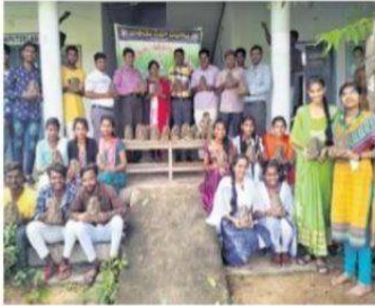
మట్టి విగ్రహాలతో విద్యార్థులు, ప్రిన్సిపాల్