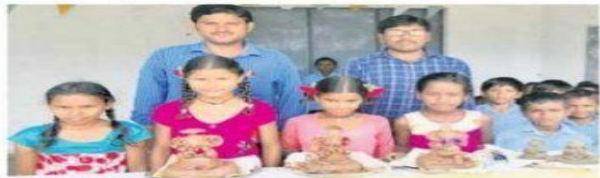
భీమిని: తయారు చేసిన మట్టి విగ్రహాలతో విద్యార్థులు