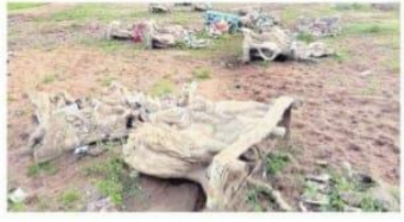
మంద్యాల గౌడవంశంలో నిమజ్జనం చేసిన తర్వాత కంకరిపాని బస్టాండ్లో పీవోపీ అండ్..

మంద్యాల అశ్వశ్రీ ఫ్యాబ్రిక్ ఆఫ్ ఫ్యాబ్రిక్ అంటారు. జిప్సమ్ దాదాపుగా 150 డిగ్రీల సెంటిగ్రేడ్ వద్ద వేడి చేసి ఫ్యాబ్రిక్ ఆఫ్ ఫ్యాబ్రిక్ తయారు చేస్తారు. పీవోపీ పొడికి నీటిని తేలిస్తే అమిశ్రమం అత్యంత గట్టిగా ఉంటుంది. నివాసాలు, కాలనీల్లో నర్సరీలు, థియేటర్లలో డ్యూం కోసం పీవోపీని వాడుతుంటారు. ఎముకలను ఆతుతులు వేయటాని కి కట్టి తల్లి కోసం పీవోపీ పొడిని మినియో గిన్నారు. నిర్మాణాల్లో ఫైబర్లలో ఆత్మీయ దృశ్యంగా ఉండటానికి మాత్రమే పీవోపీని మినియోగిస్తారు. నీళ్లలో తరిగి స్వేచ్ఛావం ఆరి తియ్యగా ఉండి పీవోపీ విగ్రహాలను నిమజ్జనం చేయటం వల్ల ఆవి దివరను అవశేషాలుగా మిగిలిపోతున్నాయి. దీనివల్ల భక్తుల మనోభావాలను చెల్లించిన టూమ్ కావడం పర్యావరణానికి తీవ్ర హాని కలుగుతోంది.