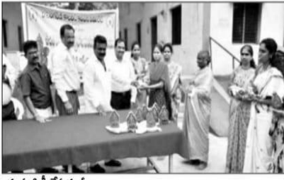
మాట్లాడుతున్న సీపీ, పాల్గొన్న వీన్ కమిటీ సభ్యులు, మట్టి వినాయకులను పంపిణీ చేస్తున్న డ్యూటీ, మట్టి గణపతులను పంపిణీ చేస్తున్న జి.ఎం