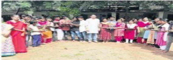
కాసిపేట: మట్టి గణపతులతో విద్యార్థులు