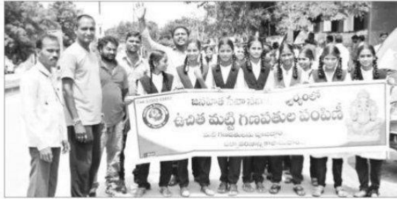
'జనహిత' ఆధ్వర్యంలో ర్యాలీ తీస్తున్న జిల్లా పరిషత్ ఉన్నత పాఠశాల విద్యార్థులు

బెల్లంపల్లి టౌన్: మట్టి గణపతులనే పూజించాలని విద్యార్థులు, ఉపాధ్యాయ సిబ్బంది ప్రజలకు పిలుపునిచ్చారు. ప్రభుత్వ డిగ్రీ కళాశాల ఎన్ఎస్ఎస్ వలంబీర్లు మట్టి విగ్ర