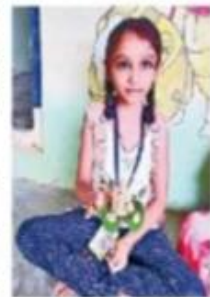
బియ్యం హియకురీతో తయారీ

బెల్లంపల్లి పట్టణం: మట్టి వినాయకులనే పూజించాలంటూ జనహిత సేవా సమితి ఆధ్వర్యంలో విద్యార్థులు ర్యాలీ చేపట్టారు. బజార్ ఏరియా జిల్లా పరిషత్ పాఠశాల నుంచి కాంటాచౌరస్థా వరకు ప్రదర్శన చేపట్టారు. పర్యావరణానికి మేలు చేకూర్చే మట్టి వినాయకులనే పూజించాలని నినాదాలు చేశారు.