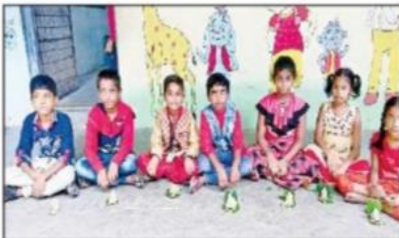
సిండితో తయారుచేసిన విగ్రహాలతో చిన్న గులు

బెల్లంపల్లి పట్టణం: మట్టి వినాయకులనే పూజించాలంటూ జనహిత సేవా సమితి ఆధ్వర్యంలో విద్యార్థులు ర్యాలీ చేపట్టారు. బజార్ ఏరియా జిల్లా పరిషత్ పాఠశాల నుంచి కాంటాచౌరస్థా వరకు ప్రదర్శన చేపట్టారు. పర్యావరణానికి మేలు చేకూర్చే మట్టి వినాయకులనే పూజించాలని నినాదాలు చేశారు.