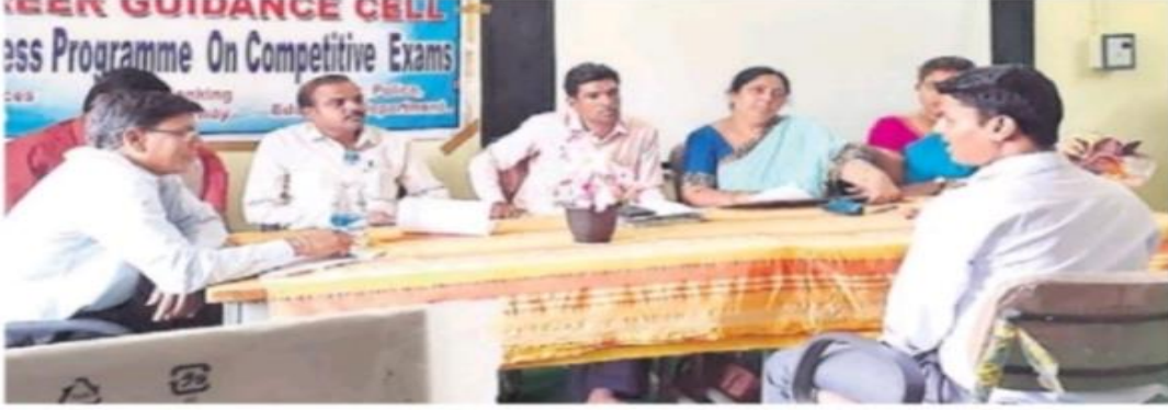
ఇంటర్వ్యూలు చేస్తున్న ప్రభుత్వ డిగ్రీ కళాశాల అధ్యాపకులు