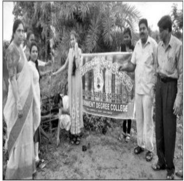
మొక్కలు నాటుతున్న దృశ్యం