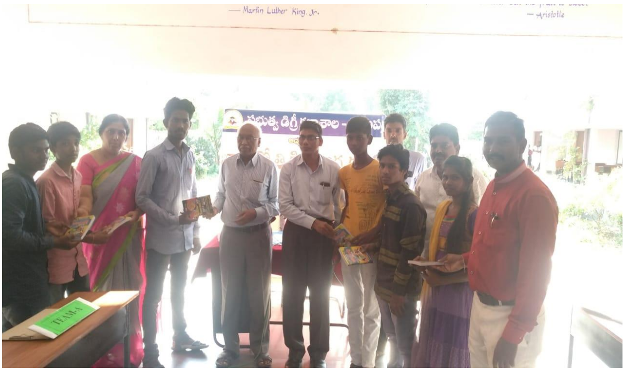
GNANA JYOTHI QUIZ COMPETITIONS ORGANISED AT GJC (G) BELLAMPALLY OF MANCHERIAL DISTRICT