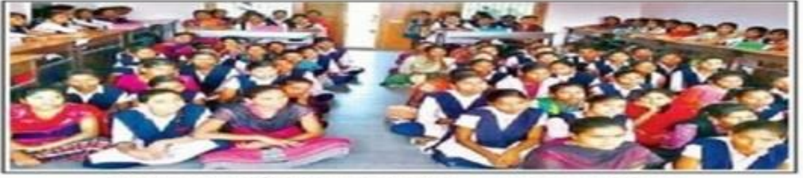
క్విజ్ పోటీలో పాల్గొన్న విద్యార్థినులు