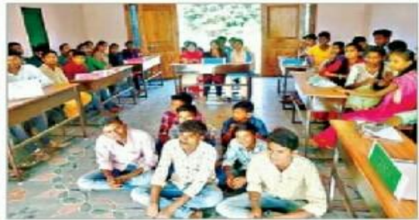
క్విజ్ లో పాల్గొన్న విద్యార్థులు