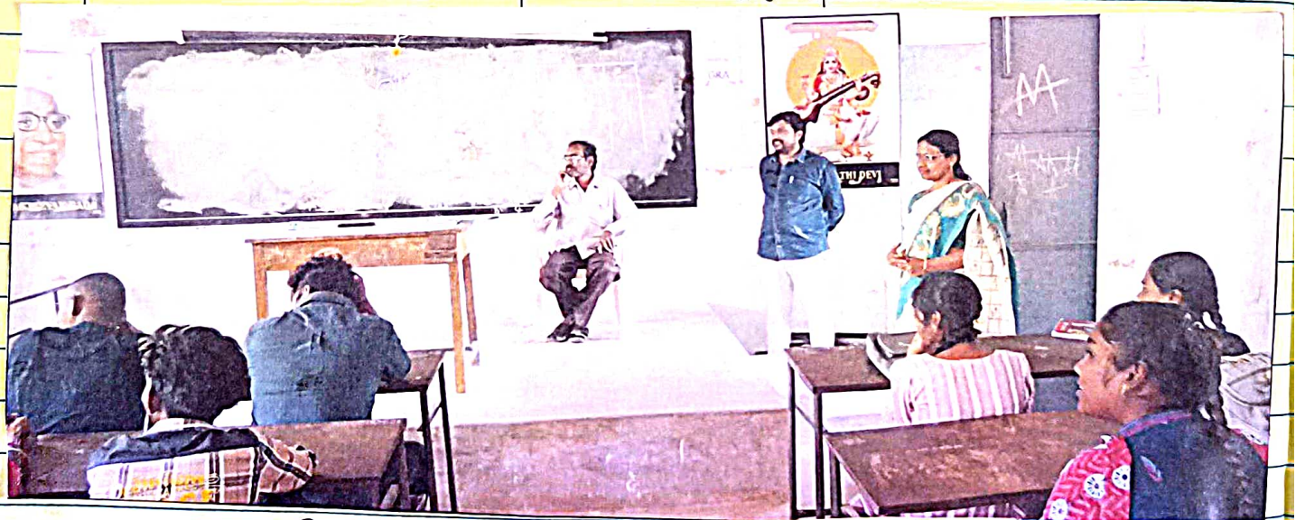
క్రికెట్ నిర్వాహకుని అధ్యక్షులు