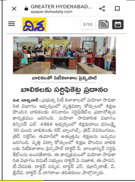
Certificate Presentation to Students