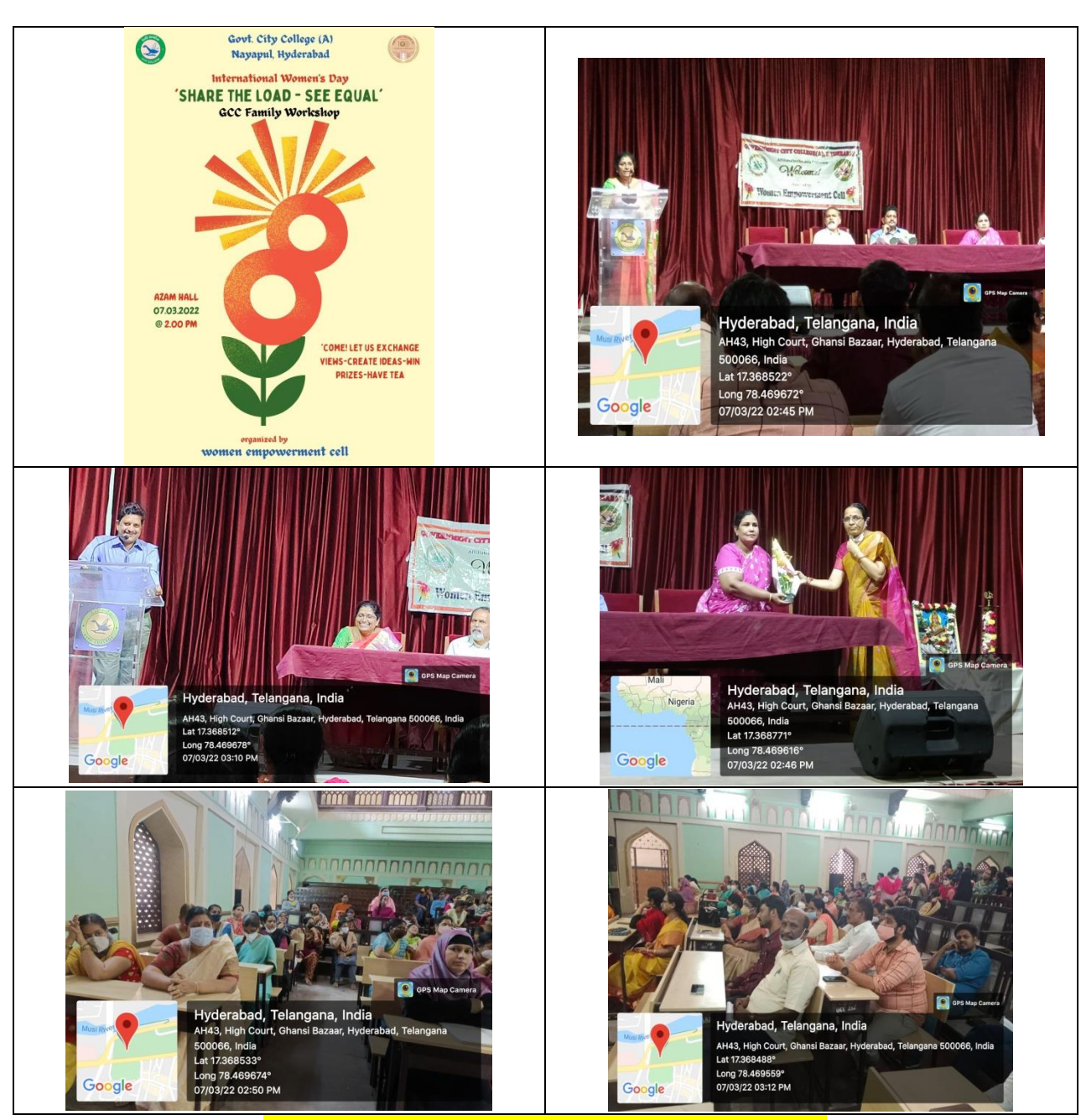
International Women's Day Celebrations