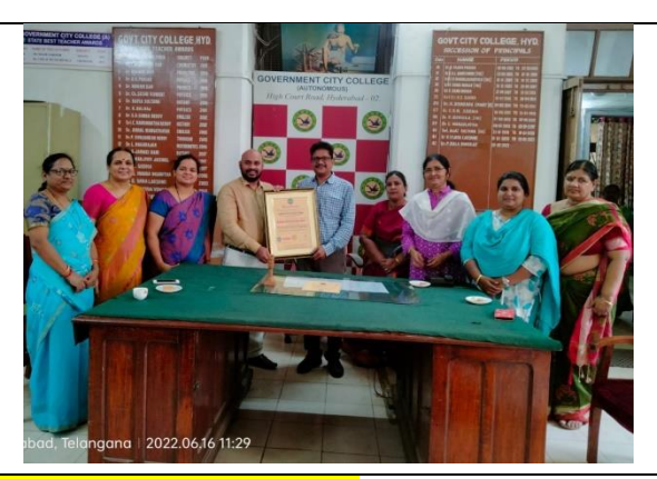
Gender Sensitization-ISO Certification