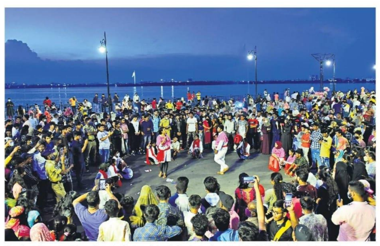
Crowd watching a street play with great enthusiasm during the Sunday-Funday at Tank Bund in Hyderabad.