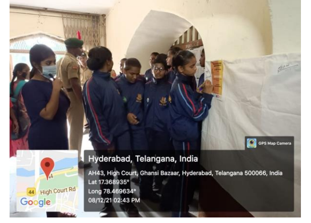
Cancer Awareness Programme -Signature Campaign