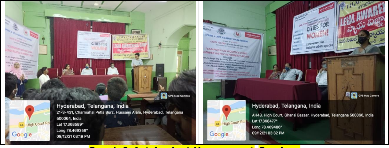
Speak & Act Against Harassment-Seminar