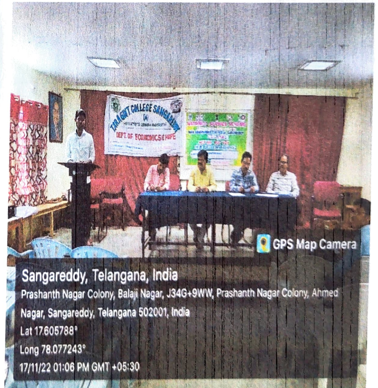
Elocution competition on Objectives of Indian Constitution on 17-11-2022