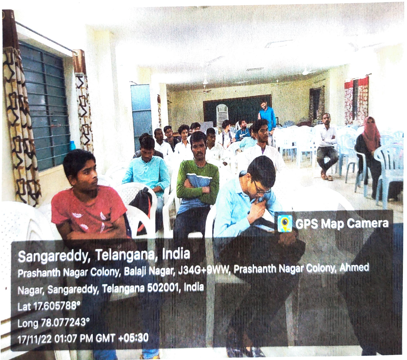
Essay writing competition on Indian Constitution and Development on 17-11-2022

GPS Map Camera Sangareddy, Telangana, India Prashanth Nagar Colony, Balaji Nagar, J34G+9WW, Prashanth Nagar Colony, Ahmed Nagar, Sangareddy, Telangana 502001, India Lat 17.605788° Long 78.077243° 17/11/22 01:07 PM GMT +05:30