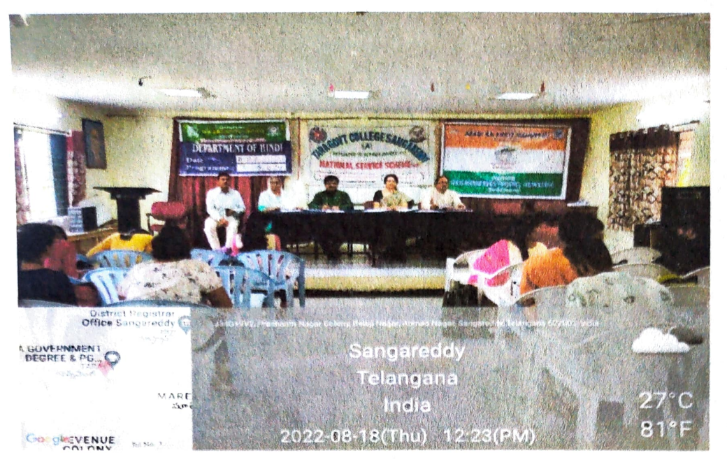
Literary Competitions in the Seminar Hall, Tara GC sangareddy (A)