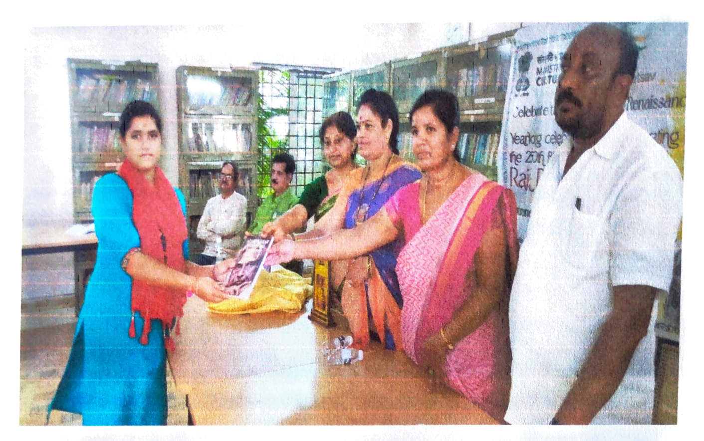
Elocution Competition winners were awarded prizes by the Dist. Library Committee