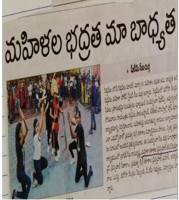
Student Conduct Flash Mod Dance/she team