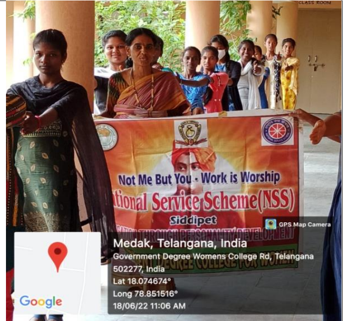
conducted international yoga day in our college