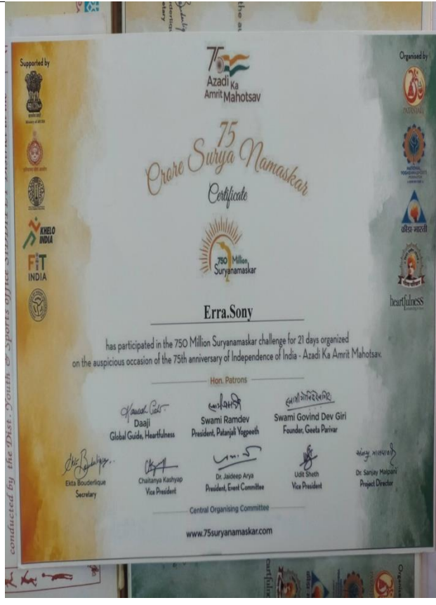
E.SONY BSC BZC-Handball player -District level champion