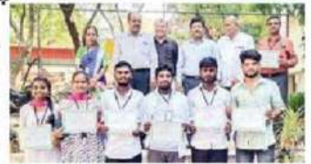
పతిభ కనబరిచిన విద్యార్థులు