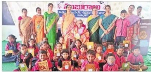
ఖమ్మం సహకారవర్గం నిర్వహించిన పాఠశాలలో వేడుకలు.