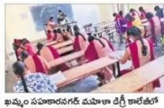
ఖమ్మం సహకారవర్గం మహిళా డిగ్రీ కాలేజీలో విద్యార్థినులకు వ్యాసరచన పోటీలు.