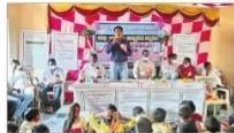
వేలకొండపల్లి: బుద్ధారం పాఠశాలలో మామిడి జమలారెడ్డి