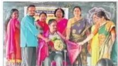
ఖమ్మం అర్బన్: కొత్తగూడెం పాఠశాలలో తెలుగు ఉపాధ్యాయులకు సన్మానం.