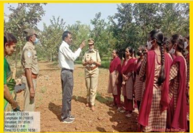
altitude: 17.233283 Longitude: 82.73315 Latitude: 20.81 Altitude: 1.8 Time: 12/20/2021 16:56