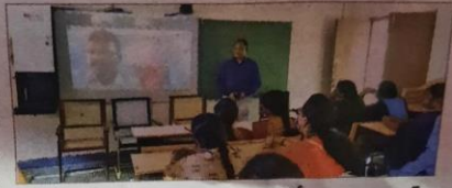
ఇంటరాక్టివ్ సెషన్ లో మాట్లాడుతున్న జీఎస్టీ అదనపు కమిషనర్