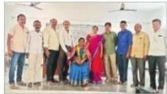
ఖమ్మం రూరల్: మంగళగూడెం పాఠశాలలో ఉపాధ్యాయులకు బహుమతులు సన్మానం.