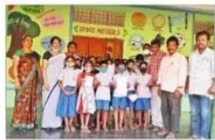
తిరుమలాయితాలెం: సుల్తాన్ పాఠశాలలో.