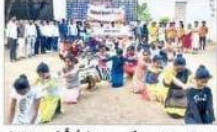
ప్రొద్దున్ డిగ్రీ, ఓకే కళాశాలలో విద్యార్థుల ప్రార్థన