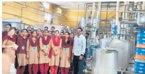
పాలకేంద్రాన్ని సందర్శించిన విద్యార్థినులు

ఖమ్మం ఎడ్యుకేషన్, డిసెంబర్ 5 : నగరంలోని ప్రభుత్వ మహిళా డిగ్రీ కళాశాల విద్యార్థినులు సోమవారం విజయ డెయిరీని సందర్శించారు. పాలను సేకరించడం, ప్రాసెసింగ్, క్వాలిటీ కంట్రోల్, ప్యాకెట్ తయారీ తదితర పలు అంశాలను క్షుణ్ణంగా తెలుసుకు