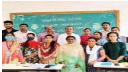
పాల్గొన్న విద్యార్థులు, ఉపాధ్యాయులు