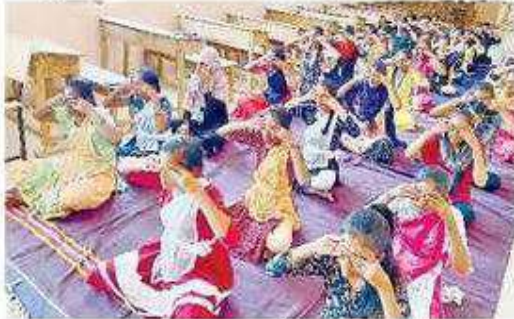
అగ్రహారం కళాశాలలో యోగా నేర్చుకుంటున్న విద్యార్థినులు