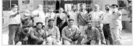
విజయ సంతోకం చూపుతున్న విద్యార్థులు, కళాశాల సిబ్బంది