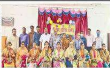
వేములవాడలో మహిళా ఉద్యోగులకు సన్మానం