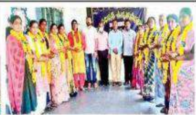
ఓమలాపూర్ ప్రభుత్వ పాఠశాలలో ...