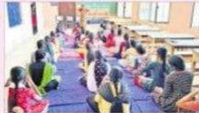
యోగా శిక్షణకు హాజరైన విద్యార్థులు