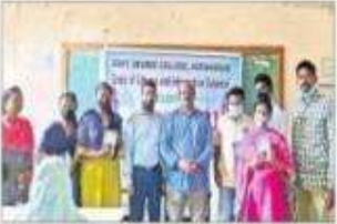
వేడుకలవాడఅర్చన బహుమతులు లండజేత