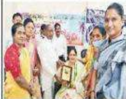
ముద్దిపాటి వైసీపీకి కౌఠవిని సాధిస్తున్న రృక్షం