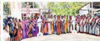
చందుర్తి మండల కేంద్రంలో...