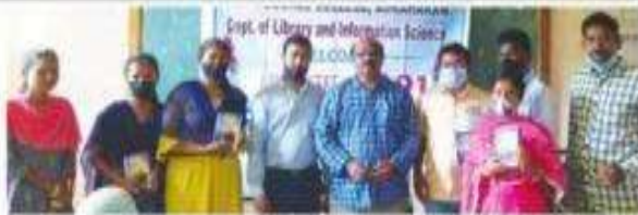
విద్యార్థులకు బహుమతులు ప్రధానం చేస్తున్న ప్రెసిపిటల్, అధ్యాపకులు