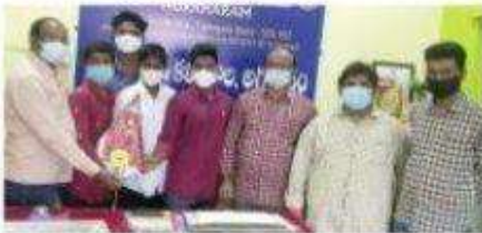
విద్యార్థులను అభివృద్ధిస్తున్న ప్రెసిడెంట్, అధ్యాపక బృందం

నవతెలంగాణ - వేములవాడ : వేములవాడ అర్బన్ మండలంలోని అగ్ర హారం ప్రభుత్వ డిగ్రీ కళాశాలలో చేపట్టిన ప్రాంగణ నియామక కార్యక్రమంలో కళాశాలకు