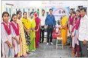
తంగళ్లపల్లి గిరిజన మహిళా డిగ్రీ కాలేజీలో..