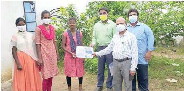
Faculty Government Degree College, Agraharam in Sircilla district reaching out to rural students motivating them to seek admission into graduate courses in the college

THE faculty of Government Degree College, Agraharam has been reaching out to the rural students motivating them to seek admission into graduate courses through a campaign on Degree Online Services, Telangana (DOST).