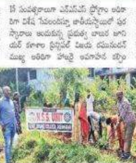
అగ్రహారం డిగ్రీ కళాశాల ఆవరణలో కుడ్రం చేస్తూ విద్యార్థులు, అధ్యాపకులు

సిరిసిల్ల(విద్యాసంగం), హ్యూస్టన్: సిరిసిల్ల లోని శ్రీకృష్ణదేవరాయ కళాశాలలో శుక్రవారం అయ్యి క్లబ్ అభ్యర్థులతో ఎన్ఎస్ఎస్ ఆవిర్భావ వేడుకలు ఘనంగా నిర్వహించారు. గత