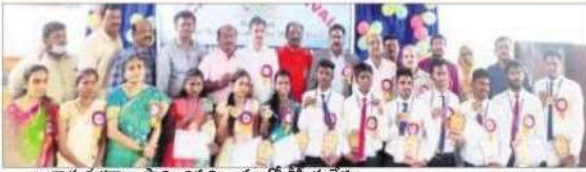
బంగారు పతకాలు సాధించిన విద్యార్థులతో వీసీ మల్లేశం

● 2018-21 విద్యార్థులకు గోల్డ్ మెడల్స్ ప్రదానం ● వీసీ సంతకాల మల్లేశం