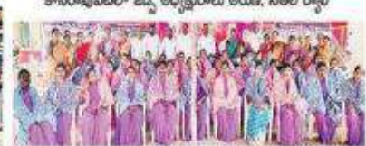
జిల్లంతులపేటలో మహిళలకు సన్మానం

Date : 08/03/2022 EditionName : TELANGANA( RAJANNA SIRCILLA ) PageNo : 03