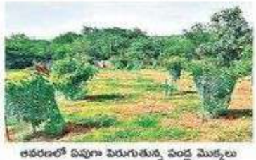
ఆవరణలో ఏవూ పెరుగుతున్న వివిధ మొక్కలు