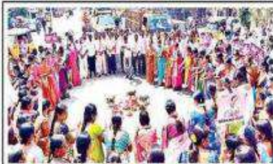
తంగళ్లపల్లిలో ఒరుకుమ్మ ఆరుతుమ్మ ప్రజాప్రతినిధులు, మహిళలు