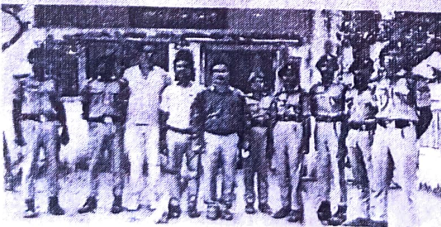
కళాశాల జనచ్ఛార్మ ప్రస్థాపిత ఎస్.ఎస్. క్యాంపస్

Principal Sri Chittem Narsireddy Memorial Govt. Degree College Narayanpet-509210. NARAYANPET-Dist. T.S.