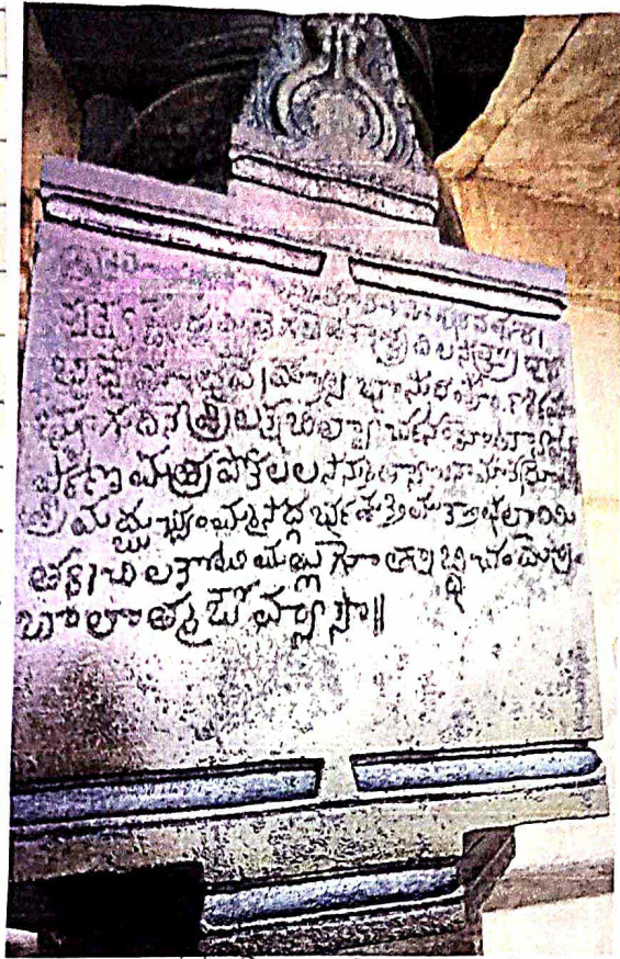
ఉమ మహాక్షరం తనీ శాసనాలు