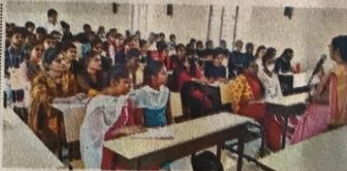
జమ్మికుంట ప్రభుత్వ డిగ్రీ, పీజీ కళాశాలలో ఇస్తోన్న ఉచిత శిక్షణ

తున్నా. కానిస్టేబుల్ ఉద్యోగాన్ని సాధించేందుకు పోటీ పడుతున్నా. ఉద్యోగం సాధించాలంటే పోటీ పరీక్షలే కీలకం. స్థానిక ప్రభుత్వ కళాశాలలో ఇస్తోన్న ఈ ఉచిత శిక్షణతో పలు విషయాలపై పట్టు సాధిస్తున్నా. కొత్త విషయాలు తెలిశాయి. ఉచిత శిక్షణ పేద విద్యార్థులకు ఫలితం ఉంటోంది. కానిస్టేబుల్ ఉద్యోగం సాధించేందుకు అర్హత కోసం రోజూ రన్నింగ్ చేస్తున్నా.