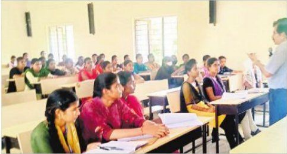
శిక్షణ తరగతుల్లో విద్యార్థులు