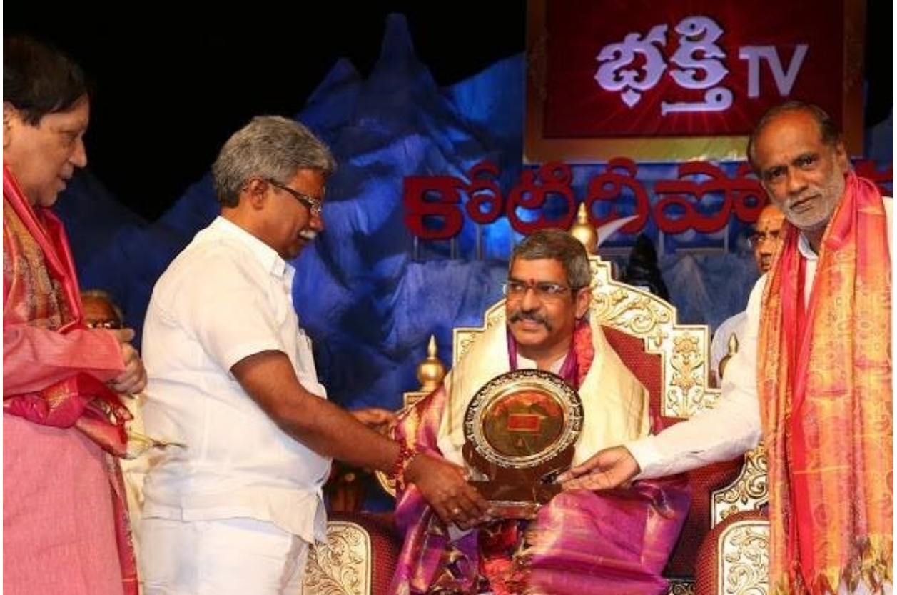
Bhakthi TV puraskaram (05-11-2014)