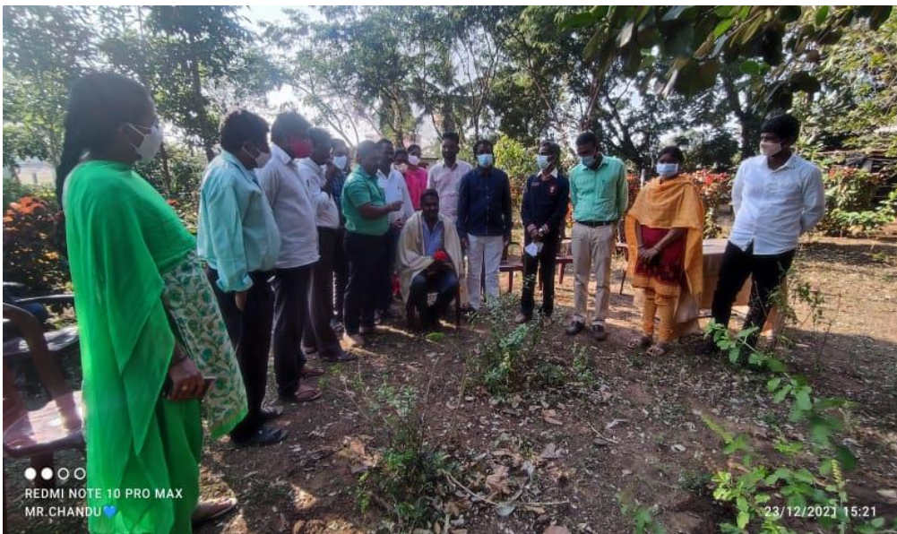
Felicitation to Organic Farmer