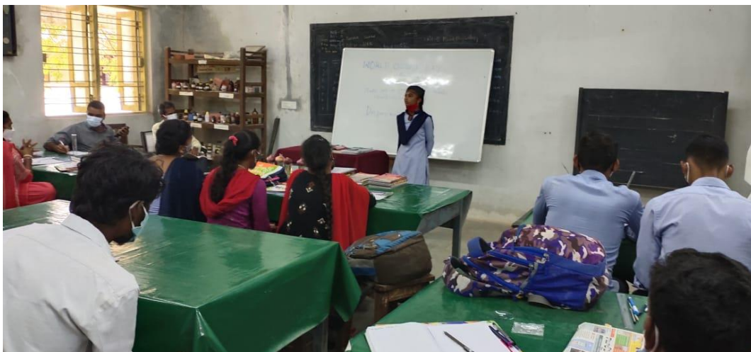
Students talk at Elocution