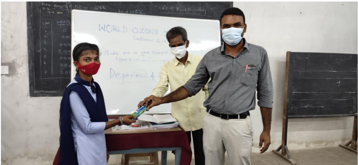
Winners of Elocution competition