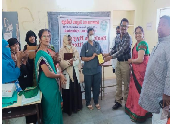
Hyderabad, TG, India Rajanna Bowli, Hyderabad, 500053, TG, India Lat 17.336971, Long 78.474529 11/11/2022 11:27 AM GMT+05:30