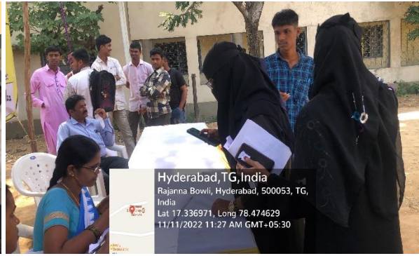
Hyderabad, TG, India Rajanna Bowli, Hyderabad, 500053, TG, India Lat 17.336971, Long 78.474529 11/11/2022 11:27 AM GMT+05:30