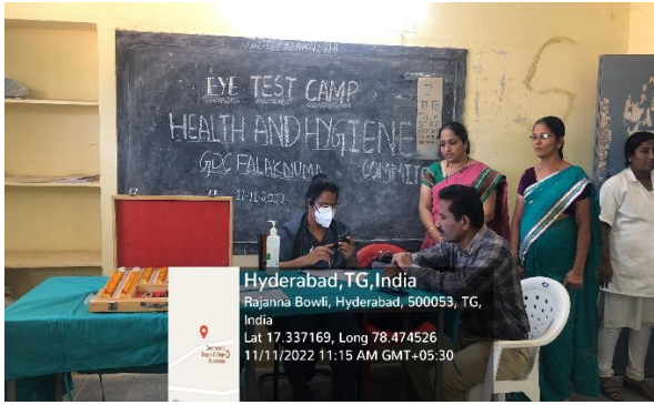
Hyderabad, TG, India Rajanna Bowli, Hyderabad, 500053, TG, India Lat 17.337169, Long 78.474526 11/11/2022 11:15 AM GMT+05:30