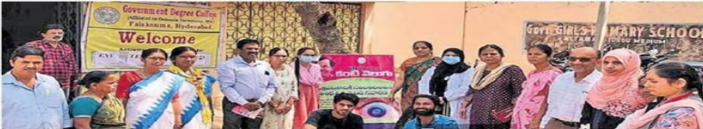
ఫలక్ సమూహం డిగ్రీ కాలేజీ ఏర్పాటు చేసిన కార్యక్రమంలో పాల్గొన్న వైద్య సిబ్బంది, అధ్యక్షక బృందం