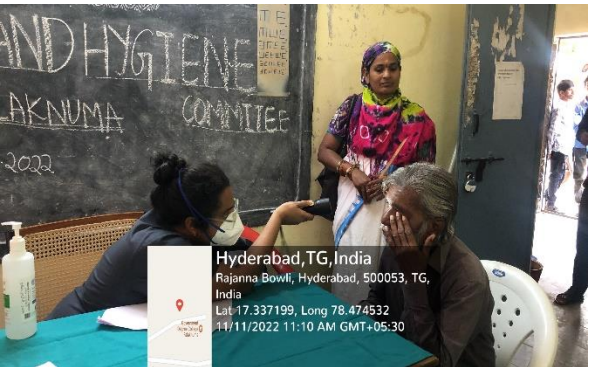
Hyderabad, TG, India Rajanna Bowli, Hyderabad, 500053, TG, India Lat 17.337199, Long 78.474532 11/11/2022 11:10 AM GMT+05:30