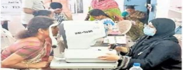
కంటి పరీక్షలను నిర్వహిస్తున్న వైద్య సిబ్బంది