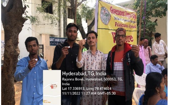
Hyderabad, TG, India Rajanna Bowli, Hyderabad, 500053, TG, India Lat 17.336913, Long 78.474624 11/11/2022 11:27 AM GMT+05:30