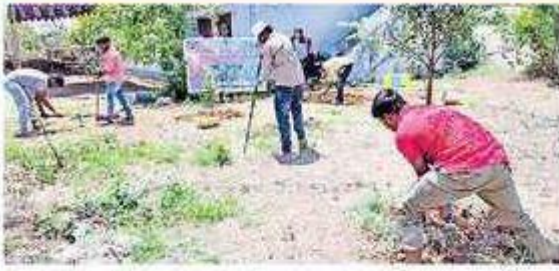
శ్రమదానం చేస్తున్న వాలంటీర్లు