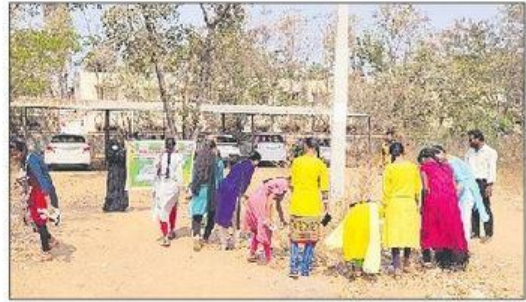
కళాశాల ఆవరణలో శుభ్రం చేస్తున్న విద్యార్థులు