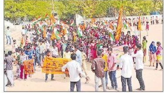
నారాయణఖేడ్: ర్యాలీలో పాల్గొన్న విద్యార్థులు