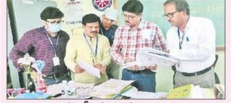
రికార్డులను పరిశీలిస్తున్న సభ్యులు