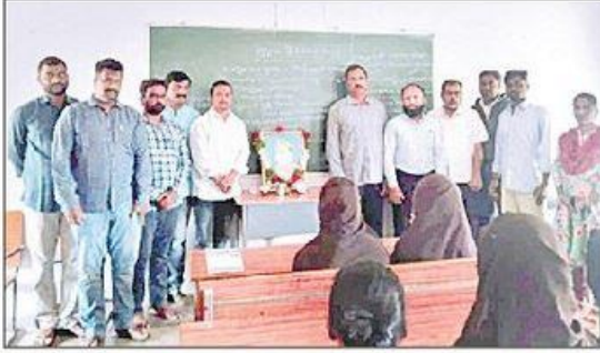
న్యూల్కల్(జహీరాబాద్): ప్రభుత్వ జూనియర్ కళాశాలలో జయంతిలో పాల్గొన్న ప్రెస్సిపాల్