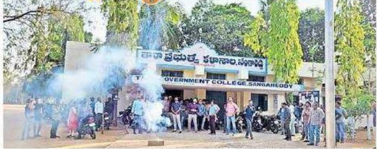
కళాశాల అవరణలో విద్యార్థులు, అధ్యాపకుల ఉత్సాహం