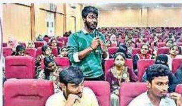
సమావేశంలో పాల్గొన్న విద్యార్థులు

యోగంతో కలిగే ప్రయోజనాలపై యువతలో అవగాహన పెంపొందించనున్నారు. ఉమ్మడి మెడక్ జిల్లాలో సంగారెడ్డి నుంచి ఈ కార్యక్రమానికి శ్రీకారం చుట్టారు. మెడక్, సిద్దిపేటలోనూ నిర్వహించేలా కార్యచరణ సిద్ధం చేశారు. డిగ్రీ స్థాయి విద్యార్థులు అధిక సంఖ్యలో పాల్గొనేలా ప్రణాళిక రూపొందించారు. చిరుదాన్యాల ప్రాధాన్యాన్ని గుర్తించేలా చర్చా వేదికలకు రూపకల్పన చేశారు. జిల్లా కేంద్రాల్లో ఆరిగే చర్చావేదికలో పాల్గొనే విద్యార్థులందరికీ ప్రువపత్రాలు సైతం అందించనున్నారు. యూత్ పార్లమెంట్లో చర్చించిన అంశాలను తమ గ్రామ స్థాయిలో చర్చకు వచ్చేలా చూడాలని విద్యార్థులకు దిశానిర్దేశం చేస్తున్నారు.