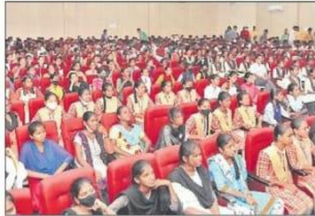
కార్యక్రమంలో కొత్త ఓటర్లు, విద్యార్థినులు