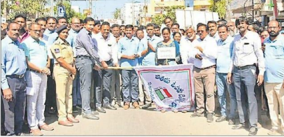
జెండా ఊపి ర్యాలీ ప్రారంభిస్తున్న అదనపు కలెక్టర్లు రాజర్షిషా, వీరారెడ్డి