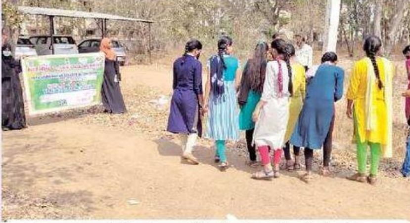
తారా డిగ్రీ కళాశాలలో పరిసరాలను పరిశుభ్రం చేస్తున్న విద్యార్థుల దృశ్యం