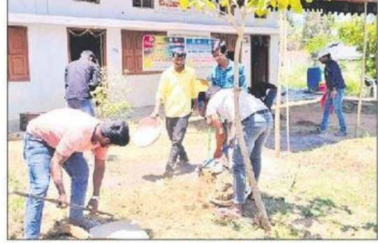
శుభ్రం చేస్తున్న ఎన్ఎస్ఎస్ విద్యార్థులు