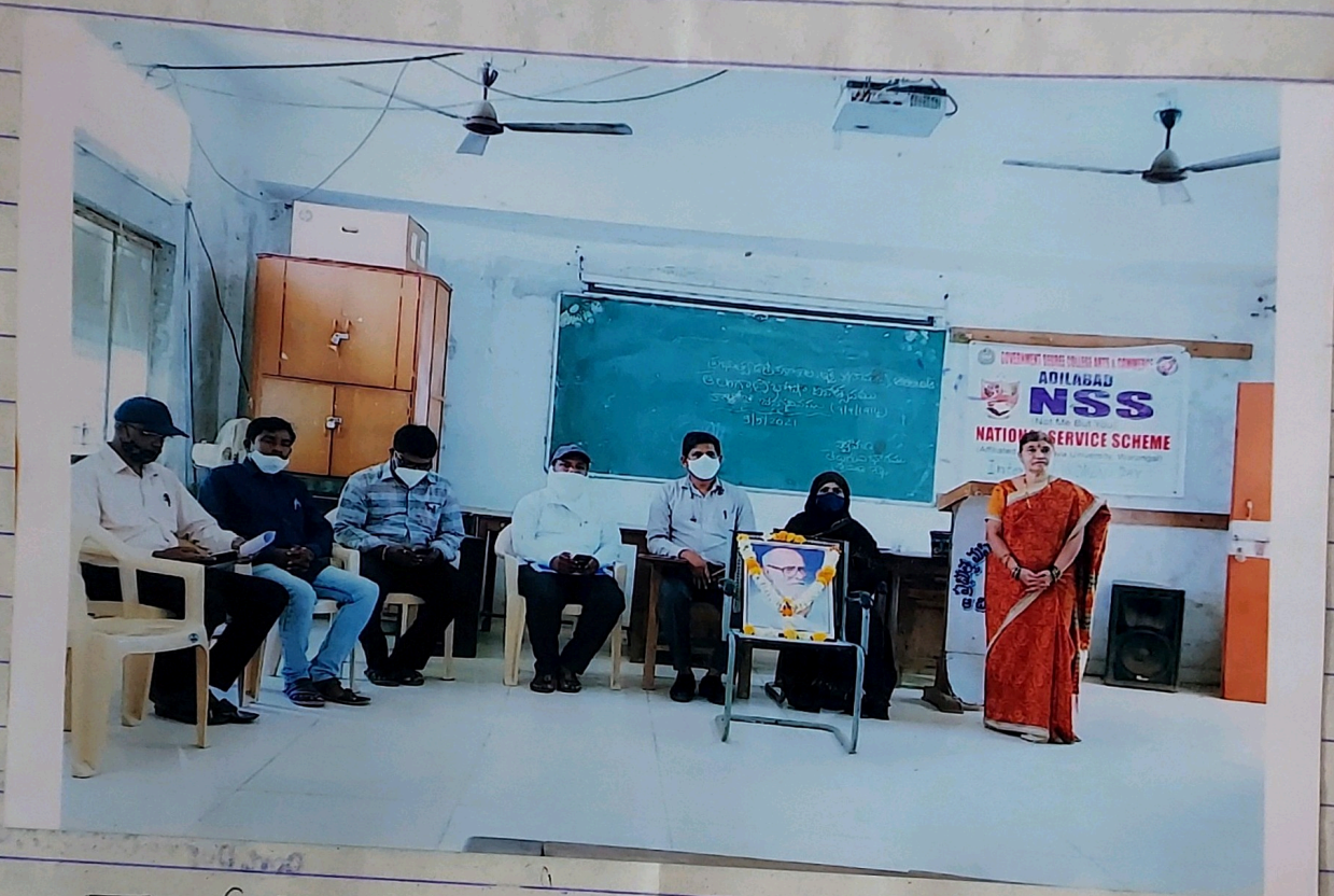
కాల్వరగి జన్మదినం సందర్భంగా ప్రవేశమవు కే-రేఖ (Telangana Bhasha Dinotsavam)