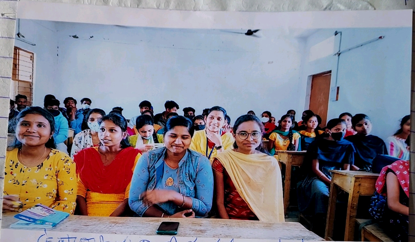
ఉపాధ్యాయ దినోత్సవము. 5/9/2021

ఉపాధ్యాయ దినోత్సవము - హనుమంత విద్యార్థులు