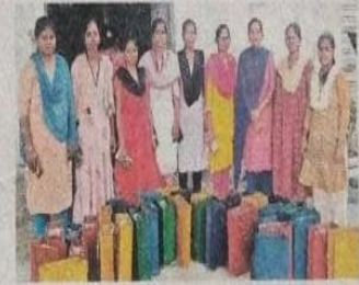
తయారు చేసిన కాగితపు సంఘలతో ఎన్టీఆర్ ప్రభుత్వ మహిళా డిగ్రీ కళాశాల విద్యార్థినులు

సమాజం నుంచి ప్లాస్టిక్ భూతాన్ని దూరం చేసేందుకు మహబూబ్ నగర్ లోని ఎన్టీఆర్ ప్రభుత్వ మహిళా డిగ్రీ కళాశాల విద్యార్థినులను సదుం దిగించారు. ప్లాస్టిక్ అనర్థాలపై చైతన్యం చేయటం తోపాటు కాగితపు సంఘలను తయారు చేసి ప్రజలకు అందుబాటులోకి తెచ్చేందుకు కృషిచేస్తున్నారు. వ్యాపార సంస్థల అవసరాలతోపాటు వివాహాది శుభకార్యాలు, జన్మదిన వేడుకల సందర్భంగా కానుకలు ఇచ్చేందుకు వినియోగించుకునేలా కాగితపు సంఘలు రూపొందిస్తున్నారు. ఇందుకు కళాశాల యాజమాన్యం విద్యార్థినులకు శిక్షణ ఇప్పిస్తోంది. చదువుతూనే ఉపాధి శిక్షణ పొందటం, ప్రజారోగ్యానికి, పర్యావరణానికి మేలు చేస్తుండటం ఆనందాన్ని ఇస్తోందంటున్నారు ఈ కళాశాల విద్యార్థినులు.