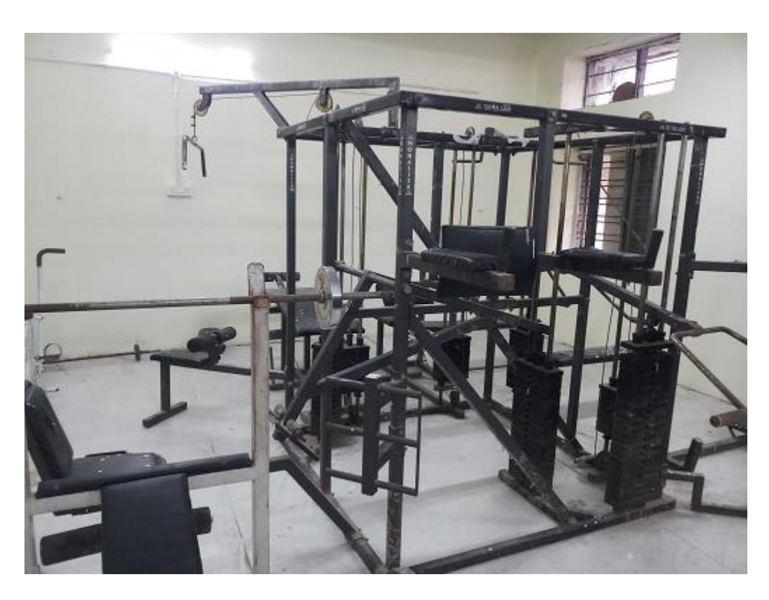
Gym Available at SKNR GASC Jagtial