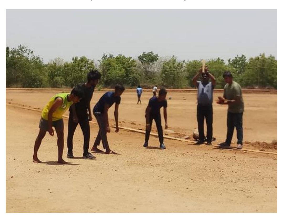
400 meters running track at SKNR GASC Jagtial