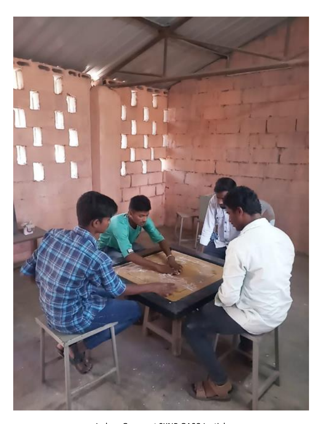
Indoor Games at SKNR GASC Jagtial