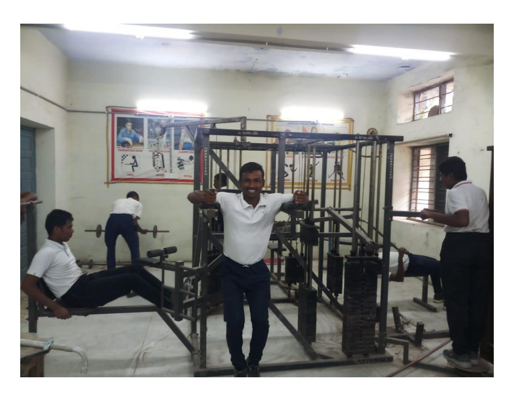
Gym Available at SKNR GASC Jagtial