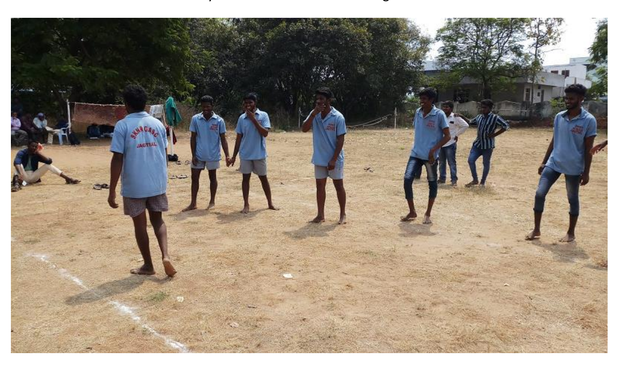
Practicing at SKNR GASC Jagtial