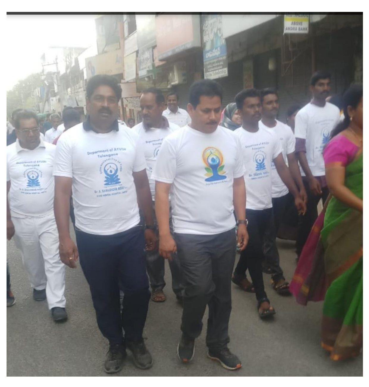
International Yoga Day Rally