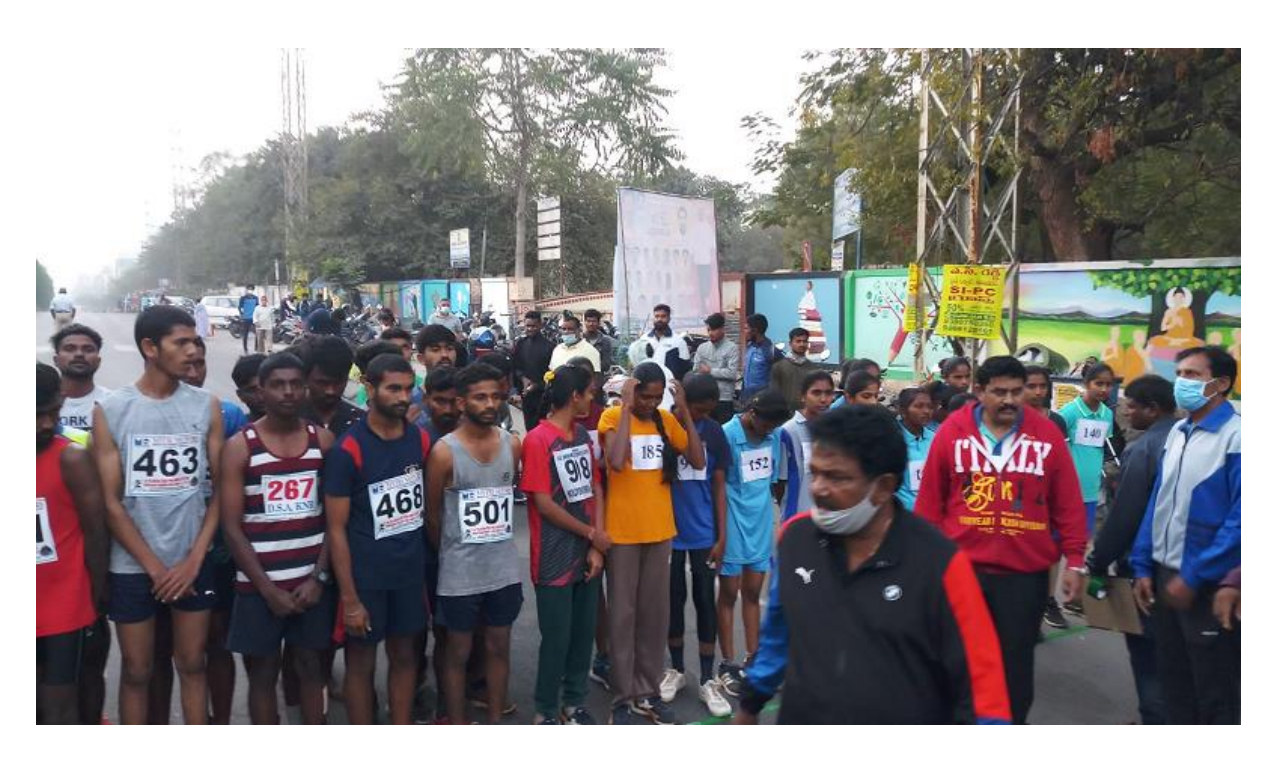
12.5 K.M Running Race (Cross Country Inter Collegiate Competition)