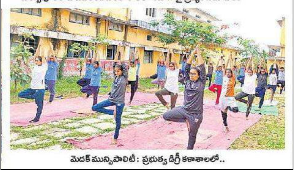
మెదక్ మున్సిపాలిటీ: ప్రభుత్వ డిగ్రీ కళాశాలలో..