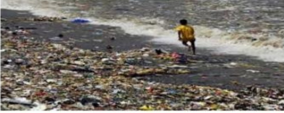
Environmental Pollution in In... freeonlineindia.in

ఐదు వేల రూపాయల జరిమానా తోనే సరిపెడుతున్నారు. ప్లాస్టిక్ నిషేధం రహిత రాష్ట్రంగా మార్చు చేయవలసిన బాధ్యత ప్రతి ఒక్కరు మీద ఉన్నది.