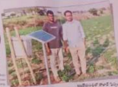
జిల్లా కార్యదర్శి కార్యక్రమం ద్వారా సోలార్ ఫిల్మ్స్ అమలు చేయడం

అయితే 72 ఎకరాల సోలార్ ఫిల్మ్స్ ఏర్పాటు కోసం కార్యదర్శి కార్యక్రమం ద్వారా సోలార్ ఫిల్మ్స్ ఏర్పాటు చేయడం అనే అంశం ప్రధాన ప్రాజెక్టులలో ఒకటిగా నిర్ణయించారు. కార్యదర్శి కార్యక్రమం ద్వారా 72 ఎకరాల విస్తీర్ణం వరకు సోలార్ ఫిల్మ్స్ అమలు చేయడం ప్రధాన ప్రాజెక్టులలో ఒకటిగా నిర్ణయించారు. కార్యదర్శి కార్యక్రమం ద్వారా 72 ఎకరాల విస్తీర్ణం వరకు సోలార్ ఫిల్మ్స్ అమలు చేయడం ప్రధాన ప్రాజెక్టులలో ఒకటిగా నిర్ణయించారు.