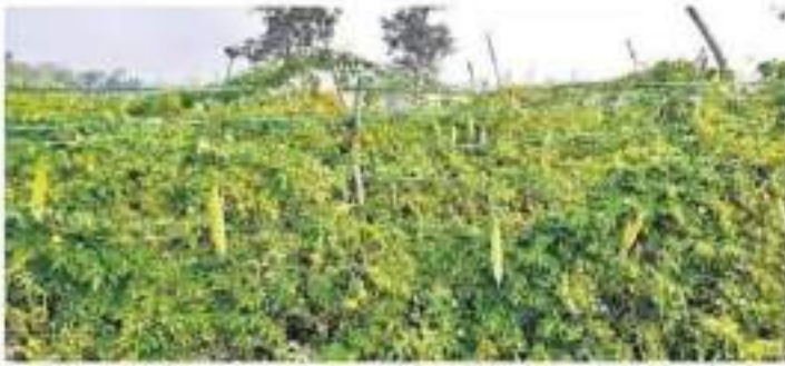
వర్షంపాలవీట మండలం వీల్పాతుండాలో బానోత్ భద్రు సాగుచేసిన కాలర తోట