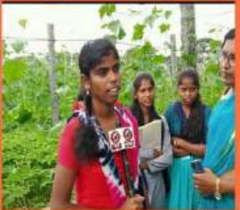
Narayanraopet, Telangana, India Tomata - Narayanraopet Rd, Narayanraopet, Telangana 502107, India