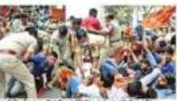
వ్యవసాయ ఆదానాపాత సదుపాయాల్లో ఆసఫీసర్లను ప్రశ్నిస్తున్న రైతులు.

వికీలక్ష్యం వికీలక్ష్యం ప్రాజెక్టును తెలుగు వార్తలు ప్రారంభించింది. ఈ ప్రాజెక్టు ద్వారా తెలుగు భాషలో వికీలక్ష్యం ప్రాజెక్టును తెలుగు వార్తలు ప్రారంభించింది.