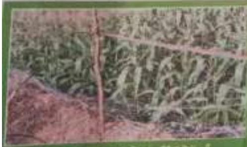
సోలార్ ఫిల్మ్స్ అమలు చేయడం ద్వారా పంటలకు రక్షణ

కార్యదర్శి కార్యక్రమం ద్వారా 72 ఎకరాల విస్తీర్ణం వరకు సోలార్ ఫిల్మ్స్ అమలు చేయడం జరుగడం అన్ని ఎత్తుల కారణాల ప్రకారం వివిధ విధాల సోలార్ ఫిల్మ్స్ వినియోగం అన్ని ఎత్తుల వరకు చేపట్టడం అనే అంశం కార్యదర్శి కార్యక్రమం ద్వారా అమలు చేయడం ప్రధాన ప్రాజెక్టులలో ఒకటిగా నిర్ణయించారు.