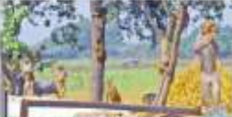
వ్యవసాయ ఆదానాపాత సదుపాయాల్లో ఆసఫీసర్లను ప్రశ్నిస్తున్న రైతులు.

జనవరి 22 వ్యవసాయ ఆదానాపాత సదుపాయాల్లో ఆసఫీసర్లను ప్రశ్నిస్తున్న రైతులు. వ్యవసాయ ఆదానాపాత సదుపాయాల్లో ఆసఫీసర్లను ప్రశ్నిస్తున్న రైతులు. వ్యవసాయ ఆదానాపాత సదుపాయాల్లో ఆసఫీసర్లను ప్రశ్నిస్తున్న రైతులు.