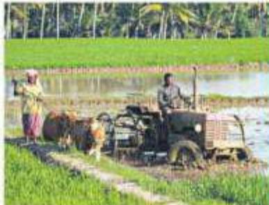
THE TELANGANA GOVERNMENT DEMONSTRATED A MODEL OF INCENTIVES AT THE RIGHT TIME FOR THE RIGHT CAUSE. INSURANCE AND TECHNOLOGY ARE THE DRIVERS OF FARM GROWTH

The nexus between the politician and farmer can be broken only with technology. Majority of farmers have smart