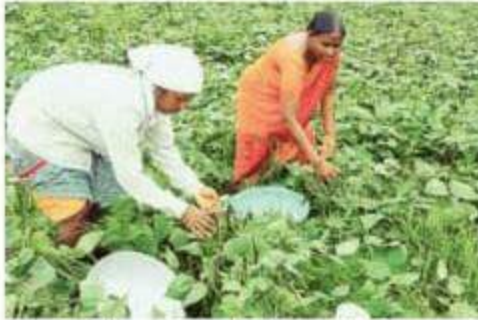
Farmers working on a field at Ibrahimpur village in Narayanaraopet mandal in Siddipet district.

However, his perspective has changed for the better. In the present season, he