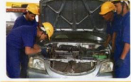
ఆటోమోటివ్ 4(w) మెకానిక్

దరఖాస్తు కొరకు కావలసిన పత్రాలు: ఆధార్ కార్డు, క్యాన్స్ సర్టిఫికేట్, స్టడీ సర్టిఫికేట్/ SSC మమ, పాస్ ఫోటోలు (4)