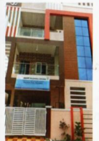
Healthcare Training center Hyderabad