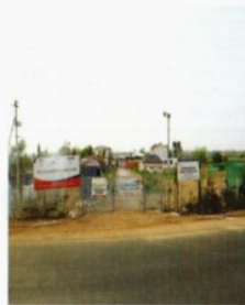
Hospitality & Automotive 4(w) Training Shadnagar

Center Head Cell: 9000049345, 9502886625