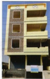
Electrical Training center Hyderabad