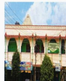
Beauty Training center Bhadradi Kothagudem