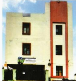
Automotive 2(w) Training center Waranagal