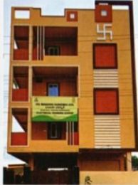
Electrical Training center Medhak