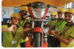
2 వీలర్ సర్టిఫైడ్ టెక్నిషియన్ లెవల్-4