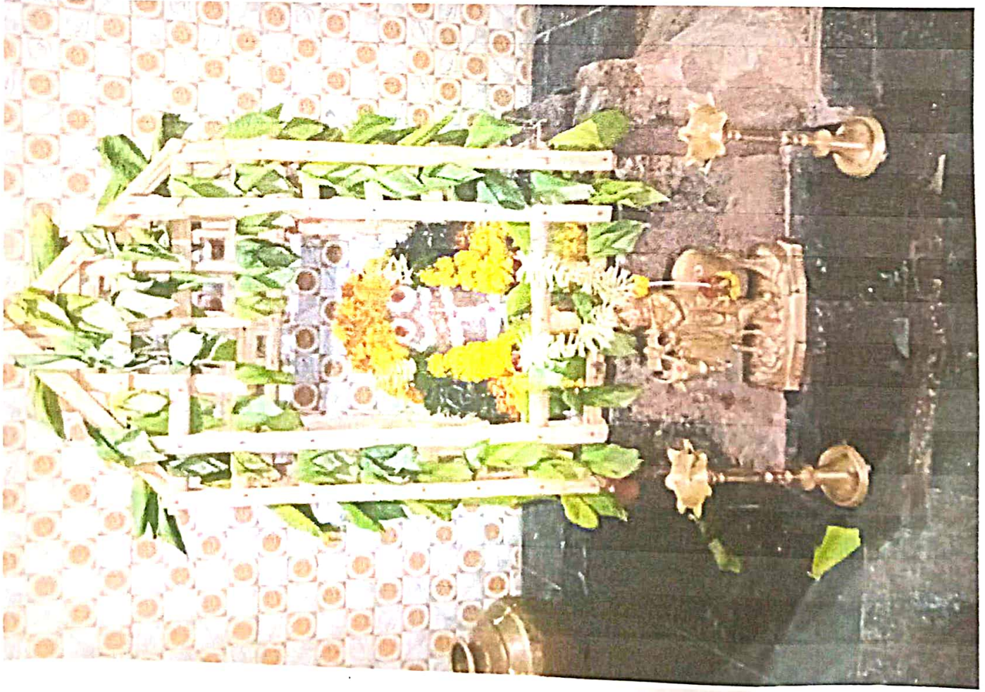
శ్రీ సోమేశ్వరం. వాళ్లంట్లం.