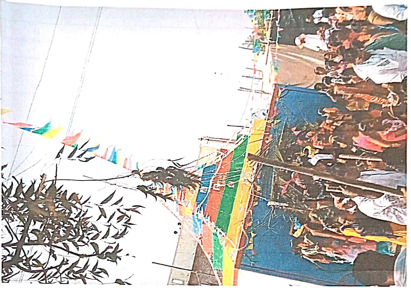
హరిదూ అవస్ ఫలం