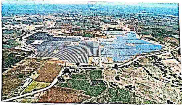
సోలార్ ఎజ్యుత్ కేంద్రం