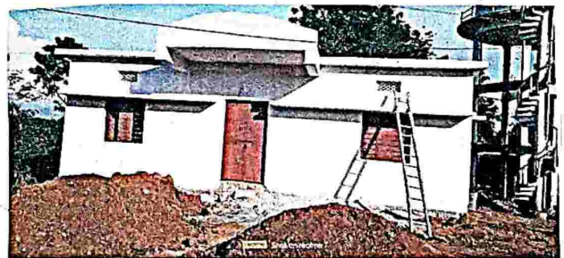
కొత్త హౌస్ బిల్డ్