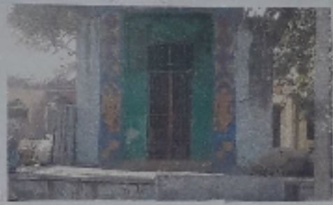
→ చింతల ముని గురు స్వామి

② చింతల గోమఠం స్వామి గుడి :- మూలమం - చింతల గోమఠం స్వామి గుడి 'కూట' గుడి మూలమం