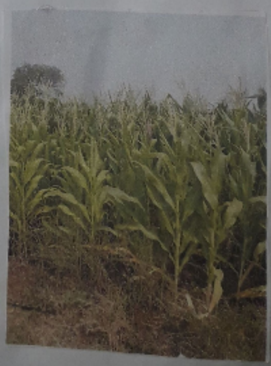
సారవంతమైన నీలము చాపకారు వంటలు