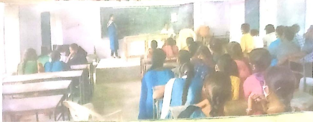
గొడగూరి మధ్య భక్తి తెలుపుతున్న విద్యార్థిని.