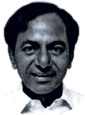
Sri K.Chandrashekar Rao Honourable Chief Minister and Chairman, TDWSCL.