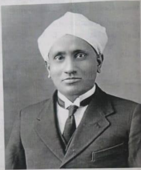
Sir. C.V. Raman Dept. of Physics