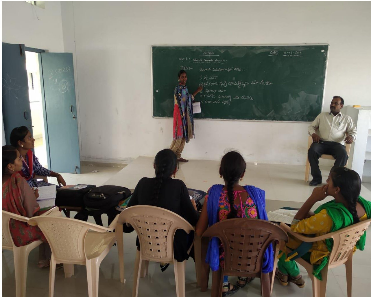
Commerce department-Students' Seminars