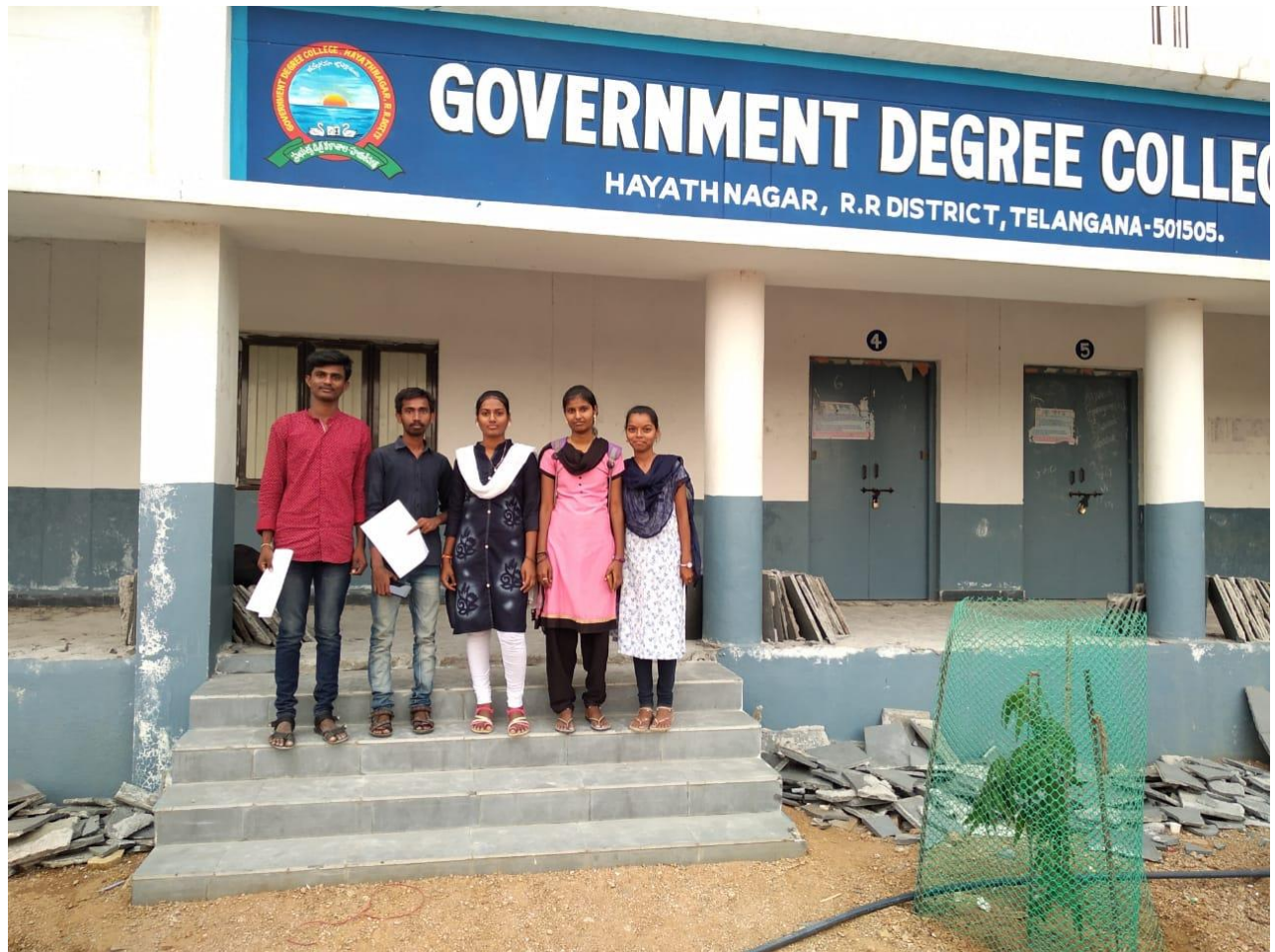
Students got selected in the preliminary test and interview at job mela-Banking sector. received final interview call letters