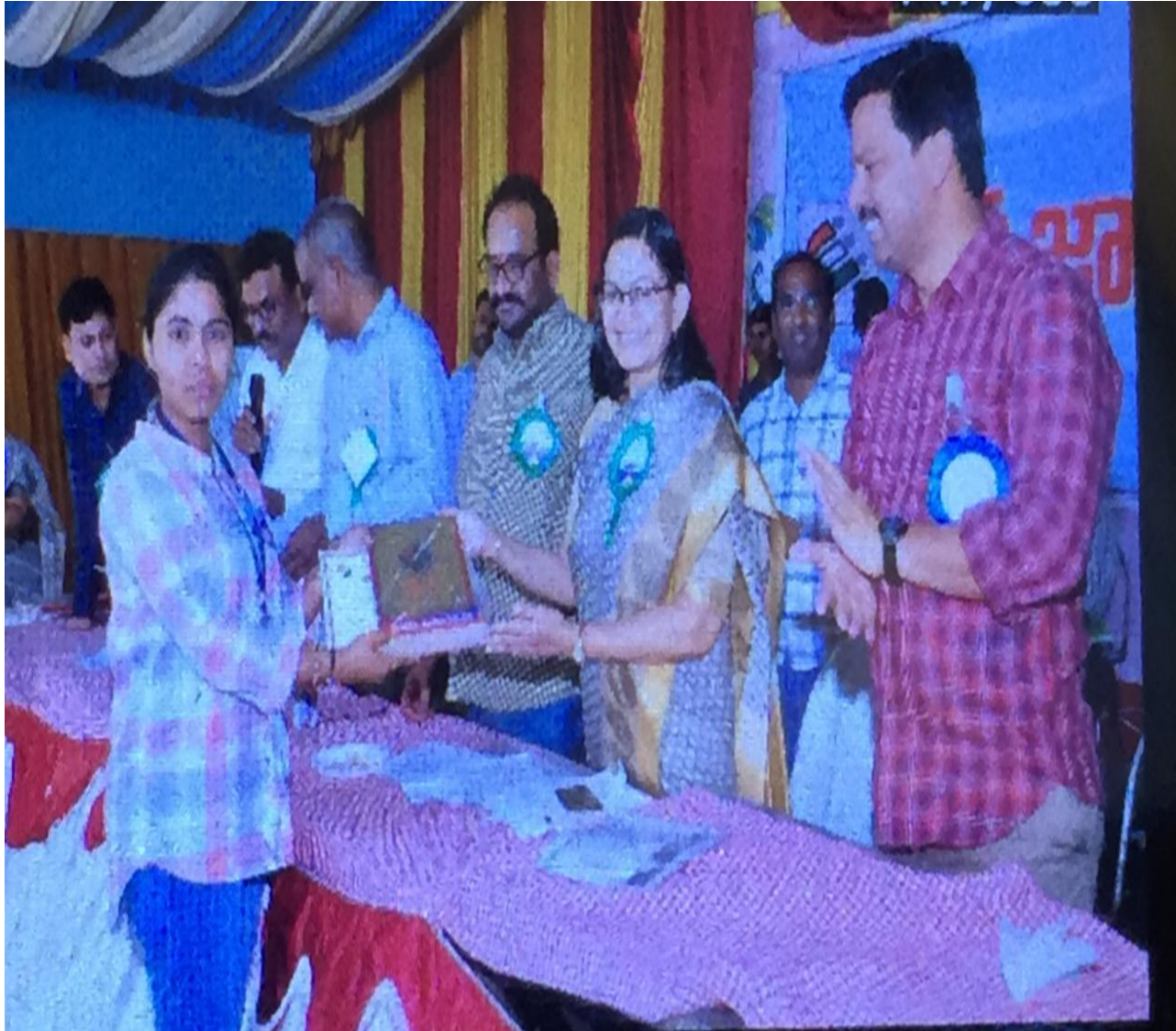
Nutana B.Com II year receiving prize from the dist Collector for Literary competition...