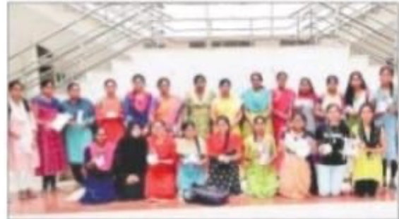
ఆవిష్కరణలను ప్రదర్శిస్తున్న విద్యార్థినులు