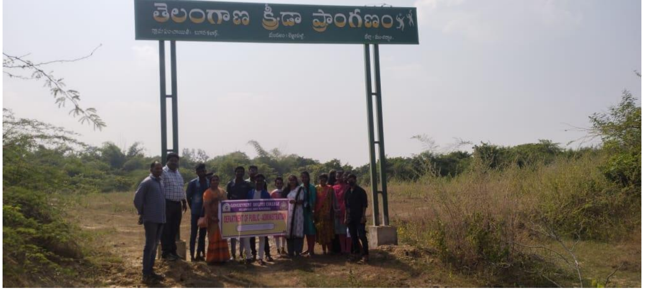
Budakalan GramaPanchayat Telangana Kreedha Pranganam