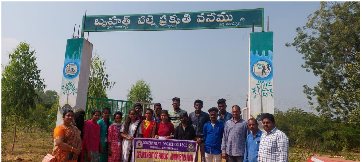
Budakalan Grama Panchayat Palle prakruthi vanam