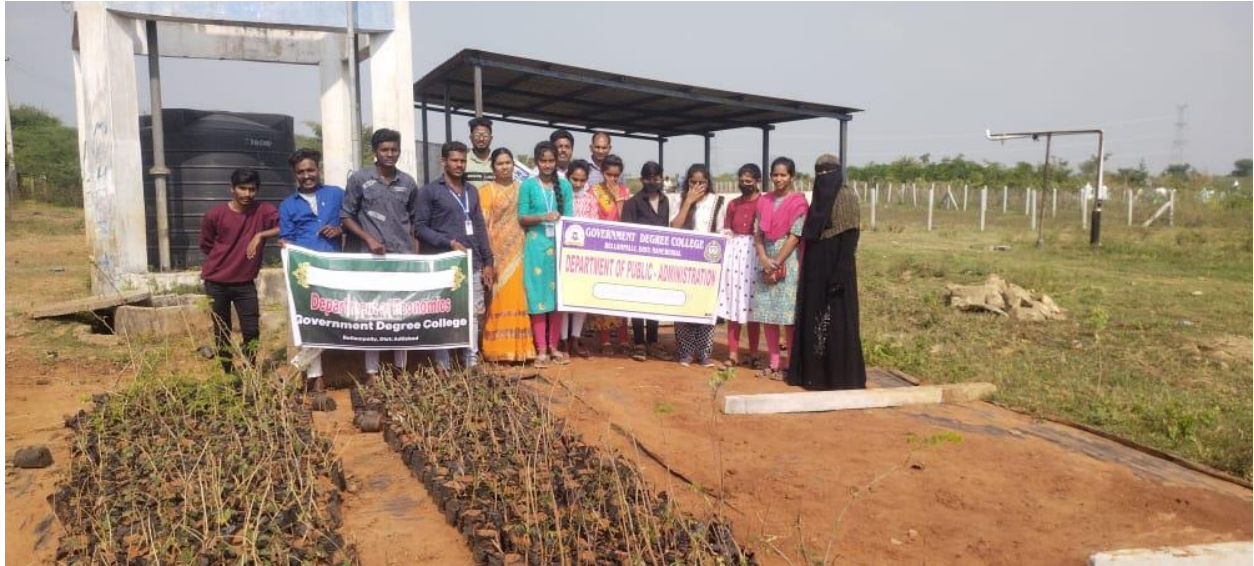
Budakalan GramaPanchayat Dumping Yard and Nursery