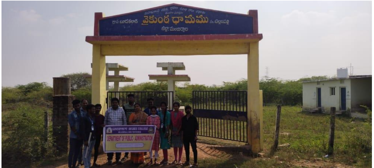
Budakalan GramaPanchayat Vaikunta Dhamam