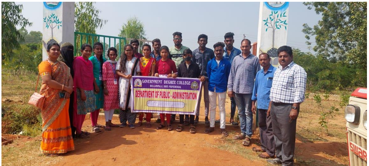
Budakalan Grama Panchayat Palle prakruthi vanam