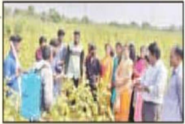
విద్యార్థులకు అవగాహన కల్పిస్తున్న దృశ్యం

బెల్లంపల్లి, నవంబర్ 9 (ప్రభన్యూస్) : బెల్లంపల్లి ప్రభుత్వ డిగ్రీ కళాశాల ల బీపి విద్యార్థిని, విద్యార్థులు బుధ వారం బెల్లంపల్లి మండలం లోని భూదాకలాన్ గ్రామంలో క్షేత్ర సందర్శన చేశారు. కళాశాల