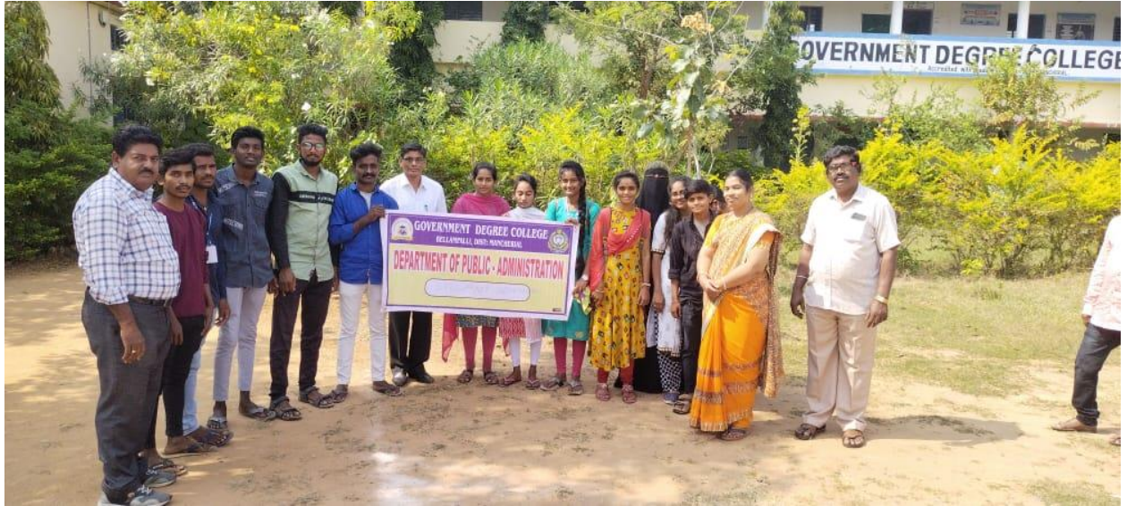
Field Trip Students Group photo with Our Principal