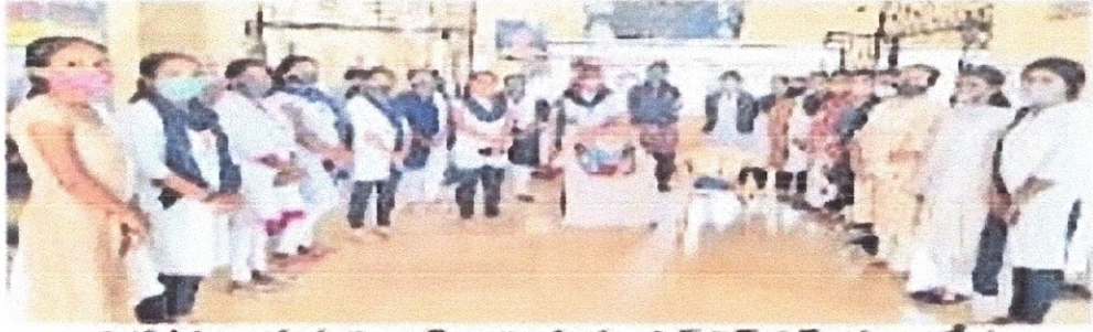
దిక్షుటం వద్ద బాటలో అంబేద్కర్ ఎంఎస్ఎస్ వలంటీర్లు