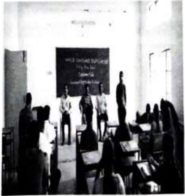
Students Participating in Elocution Competition